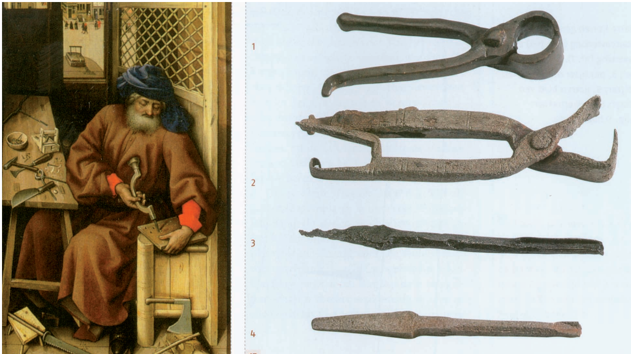
Aangetroffen gereedschappen uit de late middeleeuwen. Sint Jozef, timmerman, hanteerde 'identiek' houtbewerkgereedschap, zoals te zien is op het rechterpaneel van het Merode-altaar door de meester van Flémalle, circa 1425.

geproduceerd gebruiksardewerk, het opgegraven vijftiende-eeuwse zusterklooster Sint Elisabeth Bloemkamp en tenslotte de laatmiddeleeuwse materiële cultuur zoals die naar voren komt uit de naar omvang, variatie en conditie zeldzaam goede collectie metalen mobilia (vooral religieuze en profane insignes).