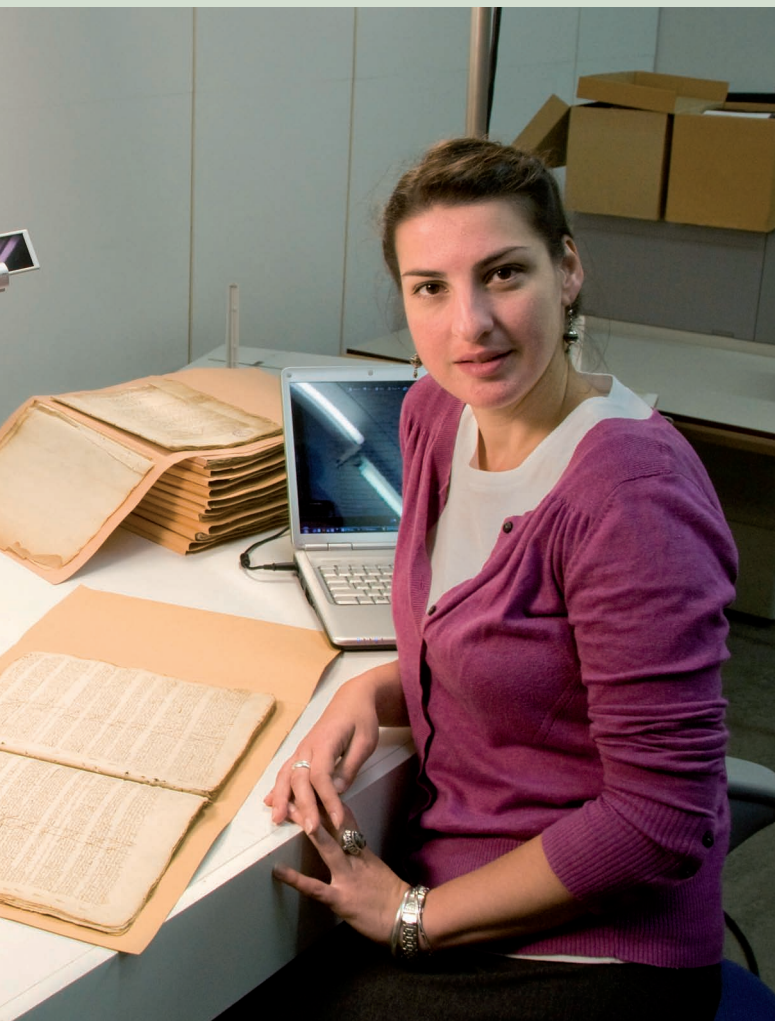
Akten uit het Bosch Protocol worden gefotografeerd; de opnamen gaan mee naar Canada.

Over een jaar of twee, drie krijgt 's-Hertogenbosch er een mooi (Engels) boek bij over de geschiedenis van de Bossche gasthuizen in de Middeleeuwen. Dat belooft Iwona Perlin eind september, vlak voordat ze na het nodige bronnenonderzoek in het Stadsarchief weer terugging naar Canada.