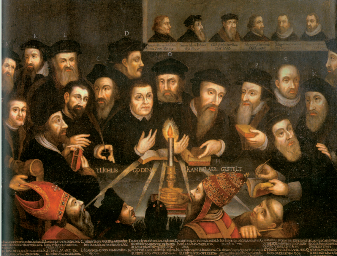
“t Licht is op den kandelaaer gestelt” (Schilderij van een anonieme kunstenaar, waarschijnlijk tweede helft 17e eeuw, Catharijneconvent Utrecht). Afgebeeld is een grote groep reformatoren, met in het midden Luther (links) en Calvin. De reformatoren hebben de Bijbel weer aan het licht gebracht. Op de voorgrond de mannen die daar niets van moeten hebben: een bisschop, een jezuiet, een paus en een monnik die tevergeefs proberen het ontstoken licht weer uit te blazen.