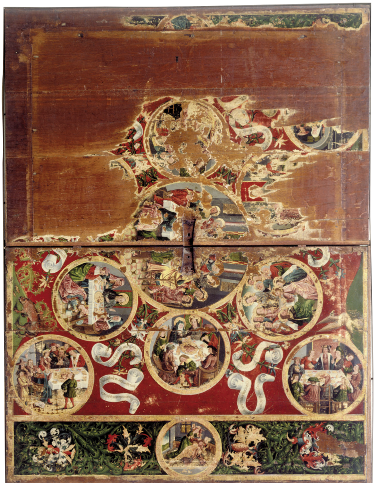
Een opvallende inzending in de categorie Oude Kunst: 'Tafelblad met bijbelse maaltijden', circa 1520. Uit de Abdij van Berne te Heeswijk-Dinther.