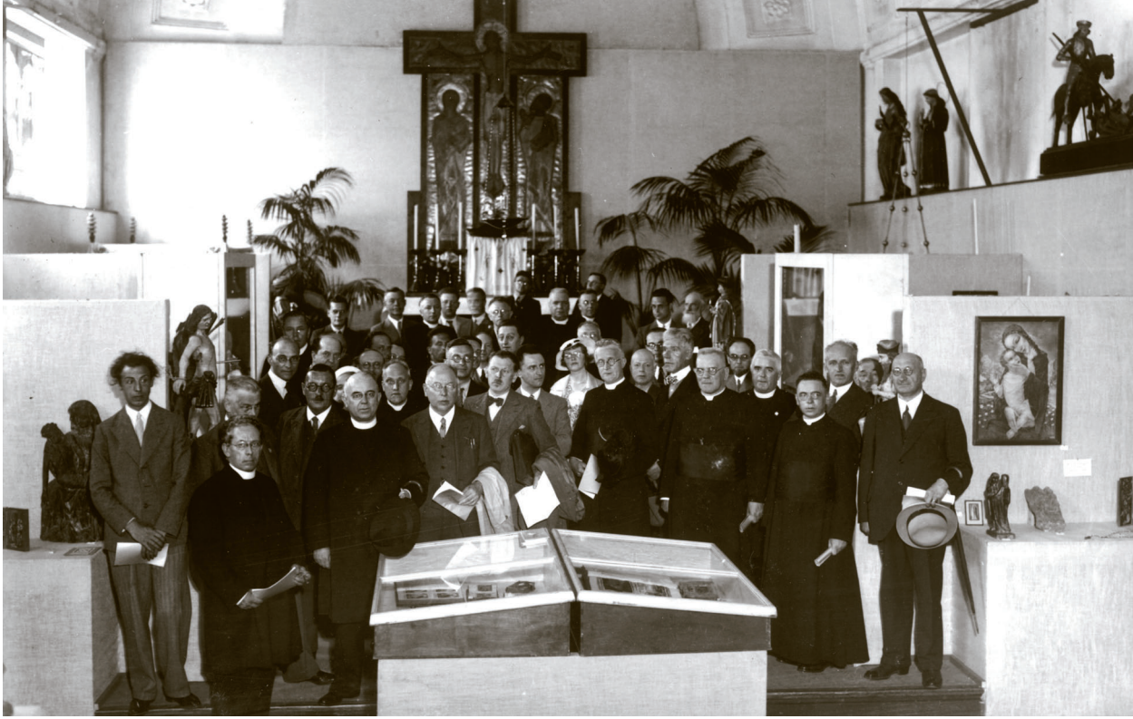
Bezoek van het St. Bernulphusgilde aan de tentoonstelling, 18 juli 1935.

kunst: het Sint Bernulphusgilde en de Algemene Katholieke Kunstenaars Vereniging (AKKV). De plaatselijke 'Studiekring Den Bosch' was medeorganisator van de tentoonstelling.