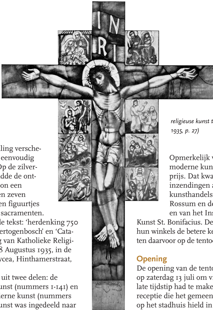
Charles Eyck, Kruisbeeld. Verblifplaats onbekend. Dit werk was nummer 269 in de tentoonstelling. (Afbeelding uit: R.K. Bouwblad, 'Katholieke religieuze kunst te Den Bosch', 22 augustus 1935, p. 27)

De inzendingen moderne kunst in de catalogus werden geordend naar de techniek waarin ze uitgevoerd waren. De categorieën waren: borduurwerk, ceramiek, metaalbewerking, plastic, glas- en muurschildering en mozaïek, meubelen, bouwkunst en houtsneden en prenten. Eén pagina van de catalogus was gewijd aan een cyclus schilderijen van Albert Servaes. Op zestien doeken had Servaes het leven van Maria verbeeld.