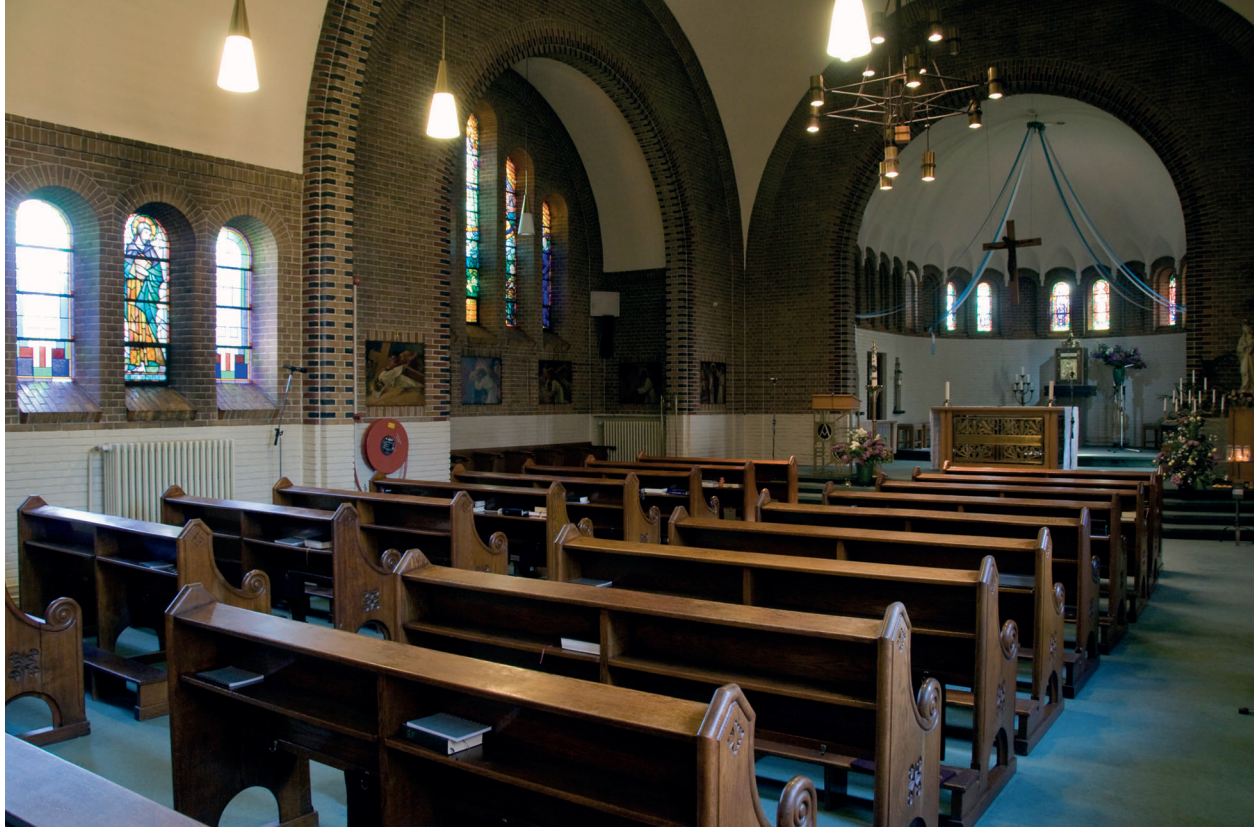
De kapel.

door de priesterstudenten worden bewoond; met dit verschil dat van de huidige bewoners eenieder de beschikking heeft over twee cellen. De slaapgang wordt in het midden onderbroken door de sacristie in wat vroeger het ziekenzaaltje moet zijn geweest, recht tegenover de kapel.