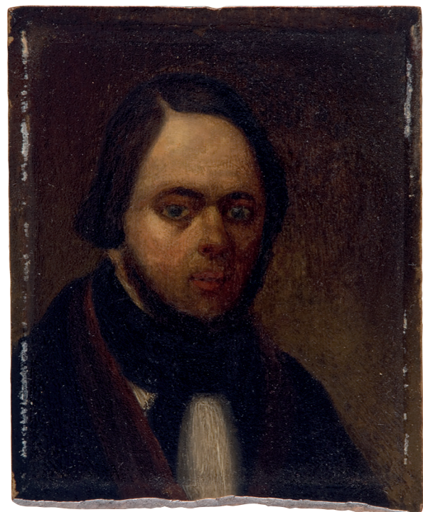
Afb. 6. Jan Hendrik van Grootvelt, Zelfportret, circa 1850. Olieverf op paneel, 13,3 x 11 cm. (Particulier bezit)

Jan Hendrik van Grootvelt exposeerde in 1828 op de eerste tentoonstelling van Levende Meesters in 's-Hertogenbosch. Deze door koning Lodewijk Napoleon geïntroduceerde landelijke exposities – voor het eerst in 1808 in Amsterdam gehouden – waren dé gelegenheid voor kunstenaars om hun werk aan een groot publiek te tonen. Op 15 september 1828 werd de 'vaderlandsche tentoonstelling' in 's-Hertogenbosch geopend met de 'uitdeeling der eerebeloningen (die) met den meesten luister plaats (had)'. 'In den vroege morgen werdt deze plegtigheid zoo