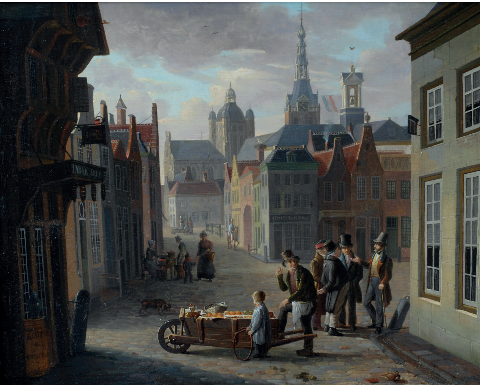
Afb. 4. Jan Hendrik van Grootvelt, De Markt in 's-Hertogenbosch , 1839. Olieverf op paneel, 34,5 x 43,5 cm. Het huis links met op de gevel 'Tabak en Snuif' en een uithangbord waarop een tabakston, is (volgens de catalogus 'Den Bosch laat u groeten', museum Slager 1978) vermoedelijk het pand genaamd 'Het Hert'. Vanaf 1817 tot ongeveer 1925 was hierin de sigaren- en tabakszaak van de familie Van der Pas gevestigd. Het huis hoek Markt/Hinthamerstraat met op de gevel 'Apotheek' was genaamd 's-Gravenhage' en heette eerder 'Milanen'. Verderop in de Hinthamerstraat is de ingang van de Sint Annaplaats te zien. (Particulier bezit)

ling van de werken der bekroonden, werd gehouden in een van de grote zalen in de stad. Vanaf 1815 vond de bekroning gewoonlijk plaats in de grote zaal van het stadhuis en de tentoonstelling in de oude concertzaal aan het Ortheneinde. Soms week men voor bekroning of tentoonstelling uit naar het gewezen commandement, het pand van de huidige Muzerije (Centrum voor Kunstzinnige Vorming en Kunst-educatie). De prijsuitreiking werd jaarlijks bijgewoond door 'provinciale en stedelijke, zoo burgerlijke als militaire autoriteiten en der aanzienlijkste