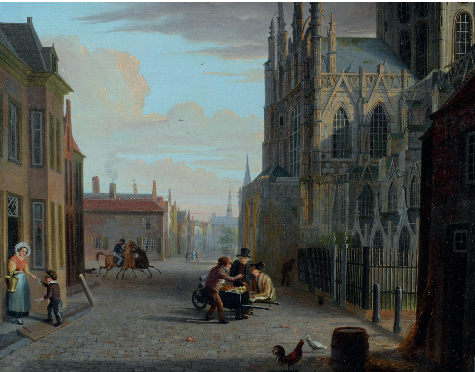
Afb. 5. Jan Hendrik van Grootvelt, Gezicht vanuit de Choorstraat op het Zuiderportaal van de Sint-Janskathedraal , 1839. Olieverf op paneel, 34,5 x 43,5 cm. In het huis links op de hoek van de Parade was destijds de Bank van Lening gevestigd. Het pand werd omstreeks 1855 aangekocht door het bestuur van de Sint-Janskerk, die daarvoor in de plaats de tegenwoordige pastorie bouwde. Rechts de ingang naar het Sint Janskerkhof. (Particulier bezit)

ingezetenen'. Maar in feite was het een openbare gebeurtenis, vrij toegankelijk voor alle belangstellenden, die daartoe door het schoolbestuur per