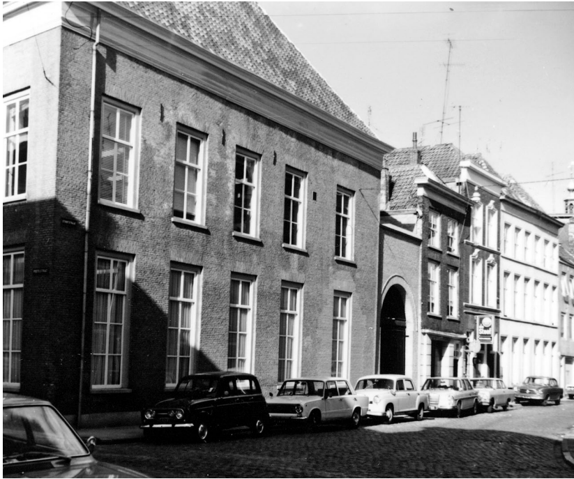
De Stoofstraat gezien vanuit de Postelstraat, 1969.