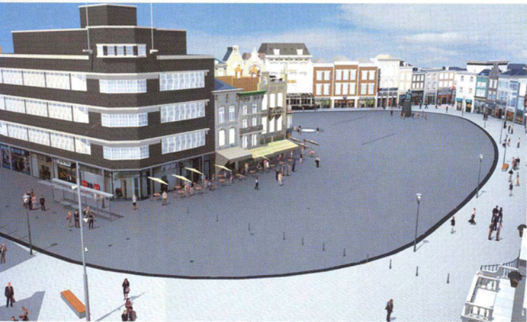
Visual door de gemeente 's-Hertogenbosch met de toekomstige inrichting van de Markt zonder puthuis en met het beeld van Jeroen Bosch voor de Hinthamerstraat.

de vorm van de stad, een hexagram. De zespuntige ster, gevormd door twee symmetrisch door elkaar getekende, gelijkbenige driehoeken – waarvan het puthuis het geografisch middelpunt is! –, heeft een basis van 7200 voet, een afstand die weer correspondeert met de lengte van de Mariaomgang. 'De stichting, het voortbestaan en de spirituele uitstraling van de stad werd ieder jaar opnieuw bevestigd. Dat gebeurde tijdens de Mariaomgang rond de zomerzonnwende (feestdag van Sint Jan de Doper), de viering van het feest van de kerkwijding. De wijding dus van de kerk die was toegewijd aan Sint Jan de Evangelist, die zijn naamdag heeft tijdens de winterzonnwende.'