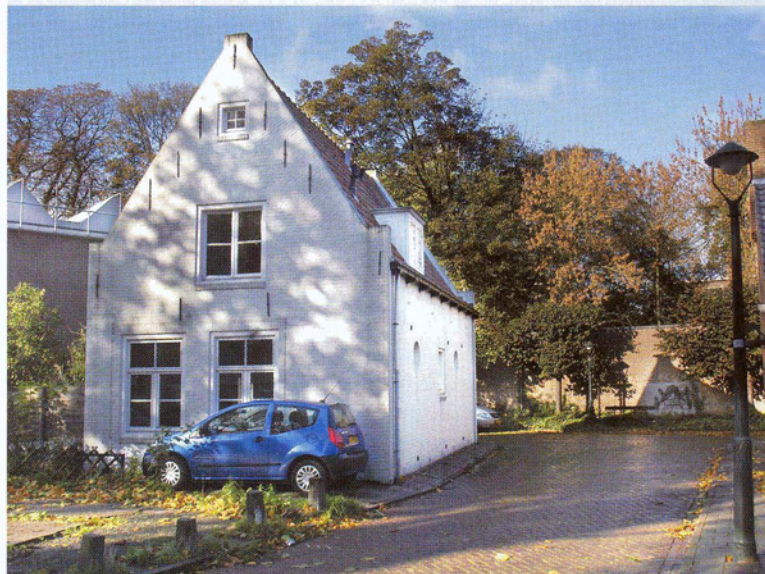
Het 'witte gebouwtje' aan het Oud Bogardenstraatje dat moet verdwijnen voor de nieuwbouw van het Museumkwartier.