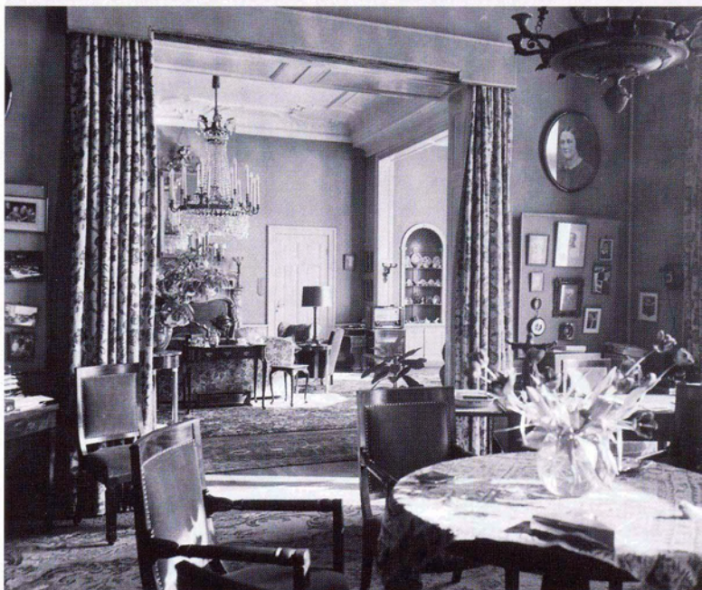
Interieur van het gouvernement toen het nog bewoond werd door de Commissaris van de Koningin.