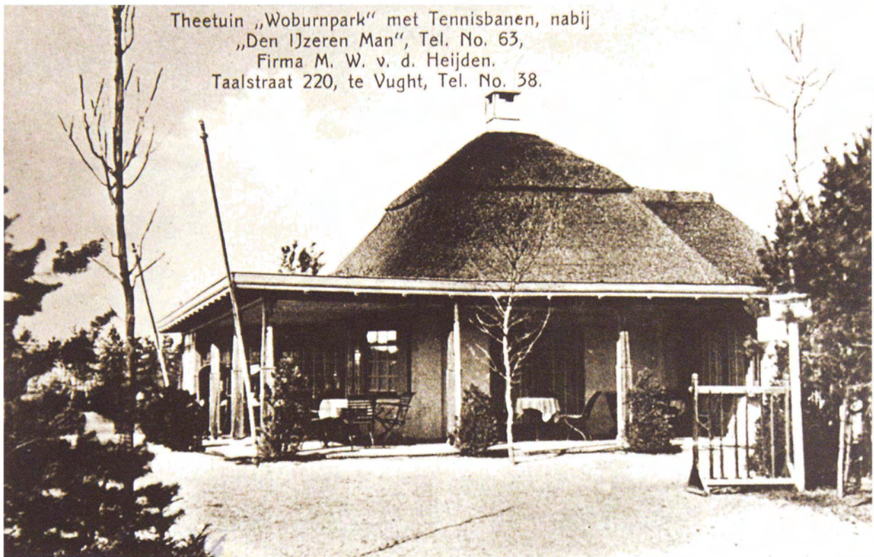
Theetuin „Woburnpark“ met Tennisbanen, nabij „Den IJzeren Man“, Tel. No. 63, Firma M. W. v. d. Heijden. Taalstraat 220, te Vught, Tel. No. 38.

Ansichtkaart van het uitgebreide theehuis Woburnpark met de nieuwe tennisbanen. De banen van Woburnpark liggen nog steeds aan de Eikenlaan in Vught. (ВНІС, Topografisch-Historische Atlas).