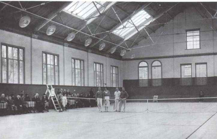
Opening van de tot tennishal omgebouwde oude manege aan de Hekellaan op 28 december 1935.

gingen ze in de zuidelijke competitie spelen ( Bandy is een variant op ijshockey). Hoewel een nauwgezette administratie van de wedstrijden met uitslagen en verslagen is bijgehouden, laat ik de sportieve geschiedenis van MOP verder buiten beschouwing. Ik beperk me tot enkele interessante stukken in het archief over de gebruikte speelvelden en over de verhuizing naar Vught.