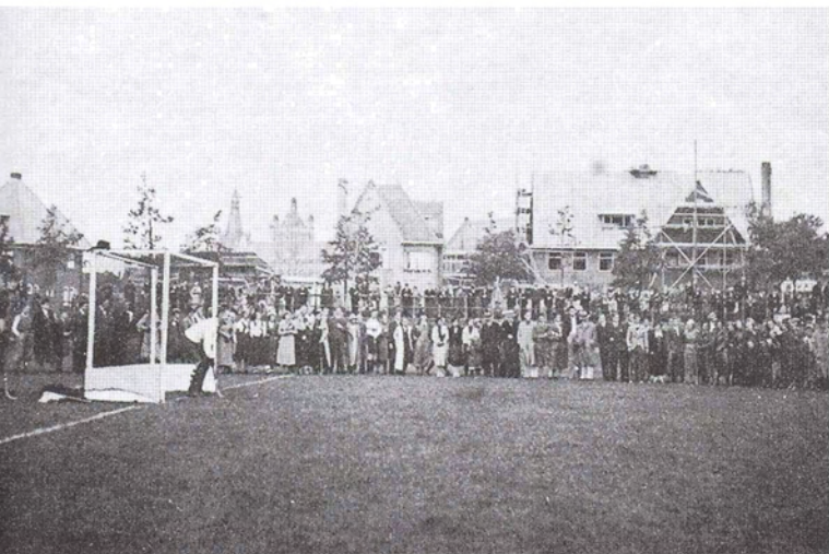
Hockeywedstrijd in het sportpark met veel publieke belangstelling. Het huis in aanbouw op de achtergrond is Hekellaan 38 en 40 (1934).

bezit van de Vughtse bakker Van der Heijden, legde de Amsterdamse firma Eylers in ieder geval drie banen aan die bespeeld gingen worden door De Bossche Lawn Tennisclub (BLTC) . De naam Woburnpark is pas in de jaren dertig terug te vinden in de archiefstukken en wordt in 1952 de officiële naam van de tennisvereniging. De naam komt vermoedelijk van het park waarin de banen waren gelegen en dat was aangelegd door de eigenares van het huis Solskin aan de Helvoirtseweg naar het voorbeeld van het Engelse landgoed Woburn Abbey.