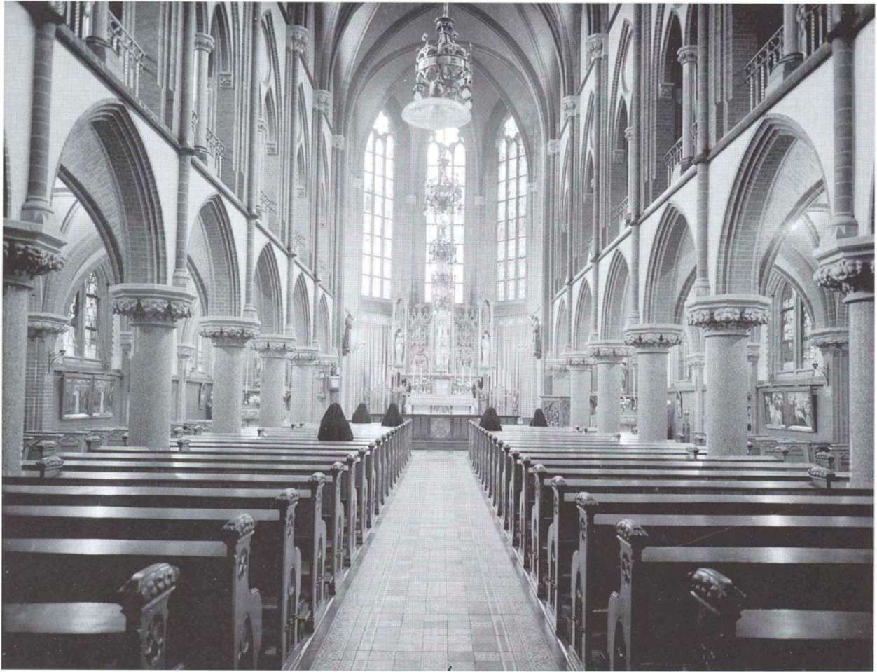
Kapel van Mariëburg. Een opname uit de jaren vijftig.