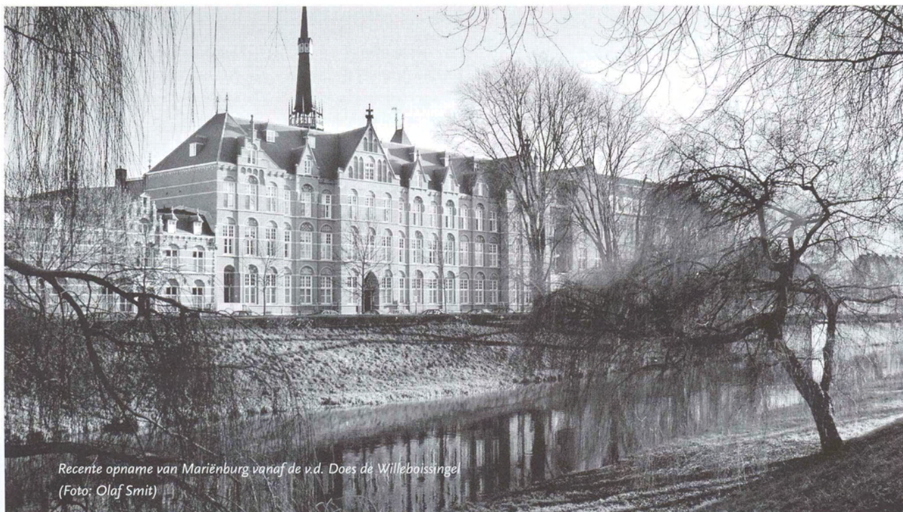
Recente opname van Mariënburg vanaf de v.d. Does de Willeboissingel