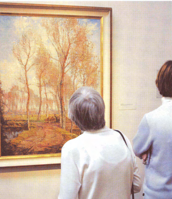
Bezoekers genieten van de 'Omgeving van de rivier de Nethe bij Meershout' (1948). Frans Slager schilderde veel in de omgeving van zijn Belgische woonplaats.