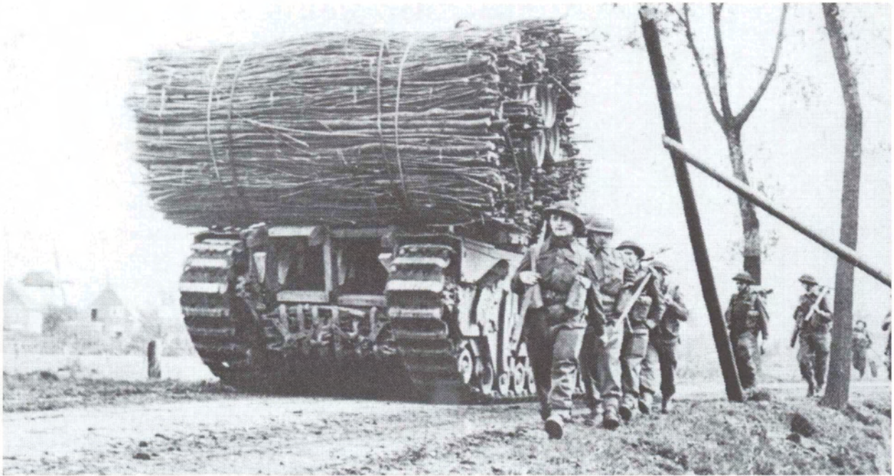
Britse troepen naderen Den Bosch. De takkenbossen op de tank werden gebruikt om over tankgrachten te komen. (Uit: L. de Jong, 'Het Koninkrijk der Nederlanden in de Tweede Wereldoorlog', deel 10a, 1e helft, 1980, p. 476)

bevelvoerders op 23 september vanuit 's-Hertogenbosch opnieuw een bataljon parachutisten om de geallieerden tegenstand te bieden, deze keer bij Schijndel. De gevechten waar deze troepen daags daarna bij betrokken raakten zorgden voor een tijdelijke blokkade van Hell's Highway . Met vele andere factoren, was dit de nekslag voor Market Garden . Na hevige gevechten werd weliswaar op 26 september de corridor weer bevrijd, maar toen was het al te laat. Omdat het de geallieerden niet lukte op tijd (lees op schema) door te stoten naar Arnhem, mislukte Market Garden in feite en liet de gehoopte snelle bevrijding nog op zich wachten. Op 25 september besloten de geallieerden om het restant Britse Airbornes bij Arnhem terug te trekken.