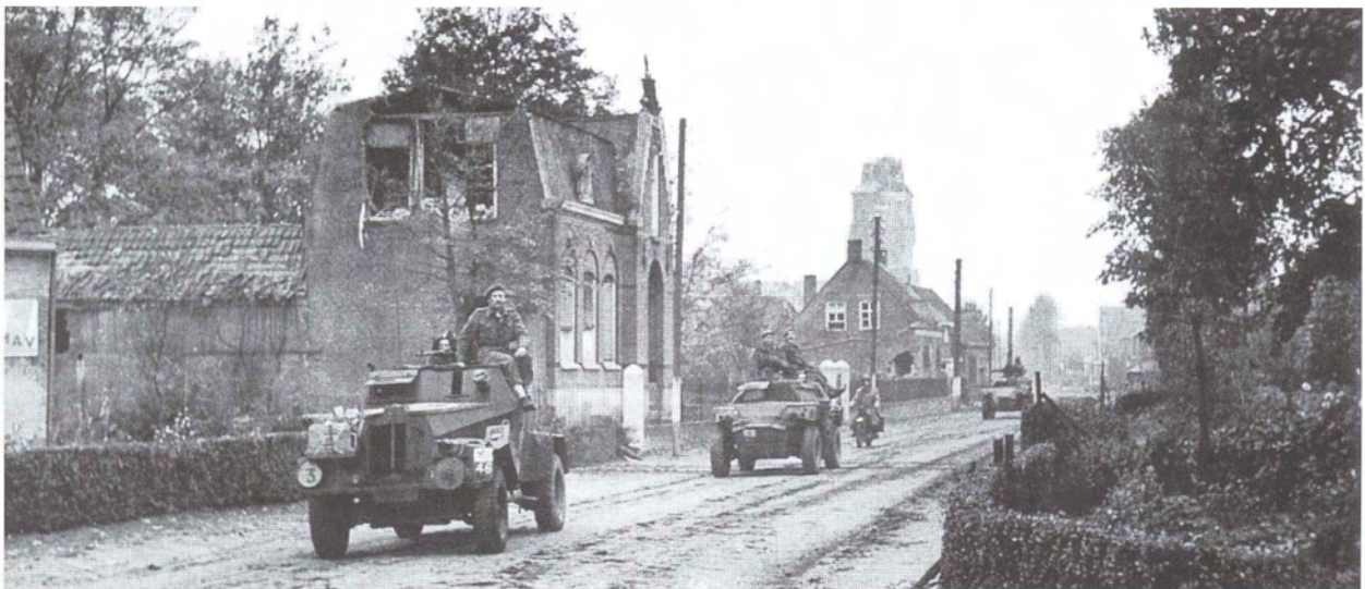
Britse verkenningsseenheden in het gehucht Doornhoek bij Berlicum, najaar 1944