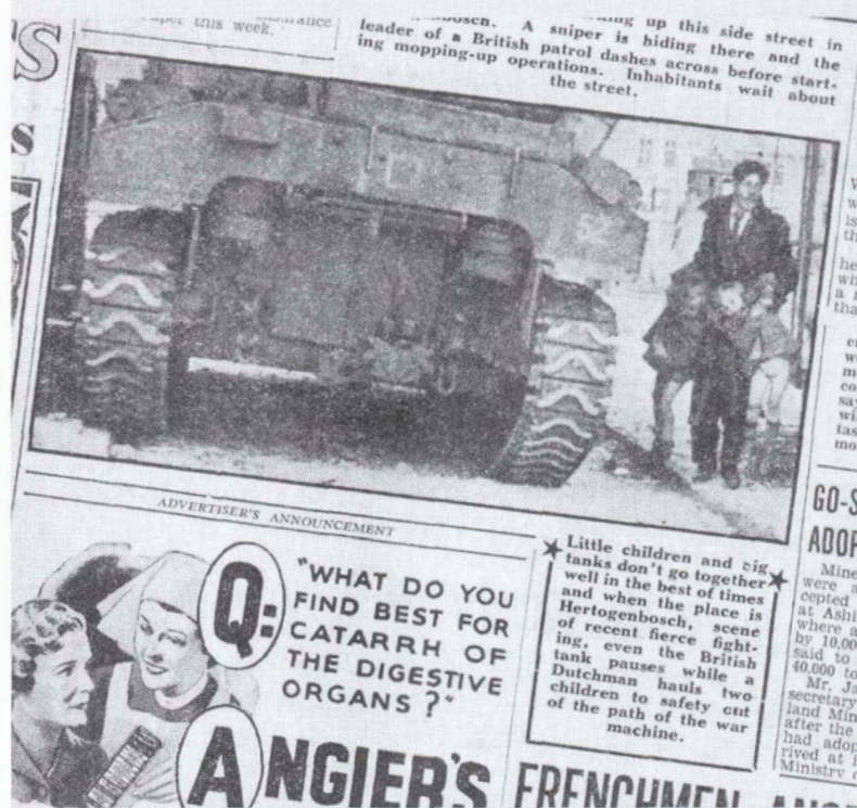
Deze bekende tijdens de bevrijding genomen foto verscheen ook in de Daily Mirror van 30 oktober 1944.