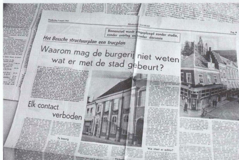
Een artikel in het Brabants Dagblad van 4 maart 1965 dat de gemoederen verhitte

Overigens beseft Jan de Wit als geen ander dat de krant ook maar een vluchtig medium is. Hij kan zich dan ook vinden in de woorden van de Duitse filosoof Schopenhauer, die ooit vaststelde dat een krant slechts een seconde van de tijd beschrijft. 'Daarmee wil hij maar zeggen, dat je de betekenis van een en ander ook weer niet moet overdrijven, maar dat doet natuurlijk niets af aan het feit dat zo'n beschrijving eeuwen nadien nog een tijdsbeeld weerspiegelt.' 'Als je door een krant, waarin de dood van Michiel de Ruyter wordt gemeld of de nederlaag van Napoleon bij Waterloo, wordt geconfronteerd met een bepaald tijdsbeeld, dan doet het je iets. Als je ziet de werkelijk macabere wijze waarop in The London Gazette van augustus 1672 verslag werd gedaan van de moord op de gebroeders De Witt, nou daar 'smul' ik van. Daar mogen ze me, bij