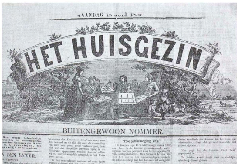
Het 'Huisgezin' van 18 juli 1870 met als belangrijkste bericht dat Frankrijk aan Pruisen de oorlog verklaard heeft.

blad. 'Dit blad, dat haar ontstaan te danken had aan het groeiende verzet tegen het progressieve katholieke kamerlid Schaeppman, kende een duidelijk conservatieve inslag, maar desalniettemin werd een fusie aangegaan met De Noord-Brabander .' De nieuwe naam: De Noordbrabantse – Noordbrabantsch Dagblad . 'Ook van deze krant mag gezegd worden dat ze de sociale actie in Brabant krachtig steunde.'