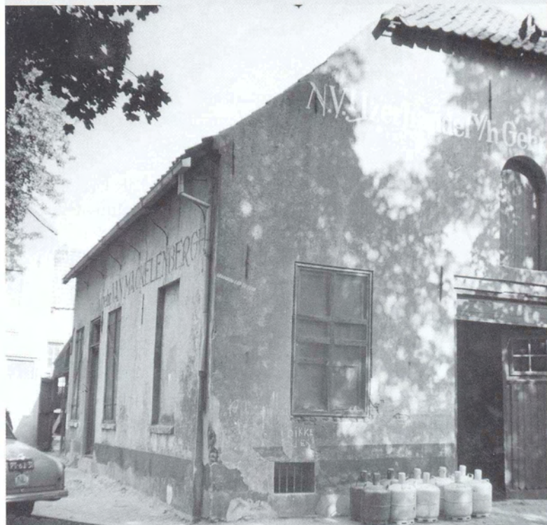
Op het Sint Janskerkhof stond vroeger deze boerderij. Toen de foto genomen werd (1959) was het pand bezit van de Gebr. Van Mackelenbergh; thans ‘St. Janshuis’.

Naast dit soort specialistische onderzoeken doet BAAC ‘alle projecten die aantasting van monumentale historische gebouwen of de archeologische ondergrond moeten voorkomen’. Wat dit betreft zijn de tijden ten goede veranderd. ‘Er komt in een historische omgeving geen bouwplan meer van de