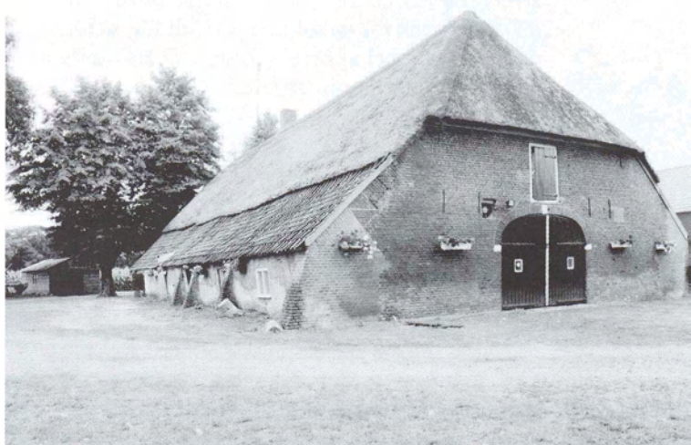
'De Duinsche Hoeve'. Zie tevens de foto op pag. 86 van deze aflevering.

Vliertwijksestraat 63 wijst het telefoonboek de weg naar De Duinsche Hoeve , de pachtboerderij die haar doopnaam dankt aan een toponiem, dat staat voor het gebied van en rond het verpleeghuis Mariaoord , waar tot voor een paar jaar de Zusters van Liefde van Tilburg ook letterlijk de lakens uitdeelden. Aan die congregatie heeft pachter Grad(je) van der Doelen (76) immer een voorbeeldige huisbaas gehad. Zo onbegaanbaar als het karrenspoor vanaf de Vliertwijksestraat oogt, zo uitnodigend baant aan de achterkant een stevige laag grind de entree tot de eerbiedwaardig oude boerderij. Dat de tot monument uitgeroepen hoeve met de achterzijde naar de Oude Baan is gekeerd, doet aan de gastvrijheid van Van der Doelen geen millimeter af, al was het maar door twee vervaarlijk blaffende herders in toom te houden. De voorkant, overigens ook niet op de Vliertwijksestraat gericht, maar echt wat je noemt oostelijk georiënteerd, weet zich deze hete zomer rijk belommerd door monumentale linden, die gezien hun gigantische omvang waarschijnlijk eveneens in de zeventiende eeuw zijn geworteld, net als de oudste relieken van de boerderij. Benieuwd naar de historie, die in De Duinsche Hoeve huist, weten we ons deskundig gegidst door Rob Gruben, directeur van 'BAAC BV Bouwhistorie en