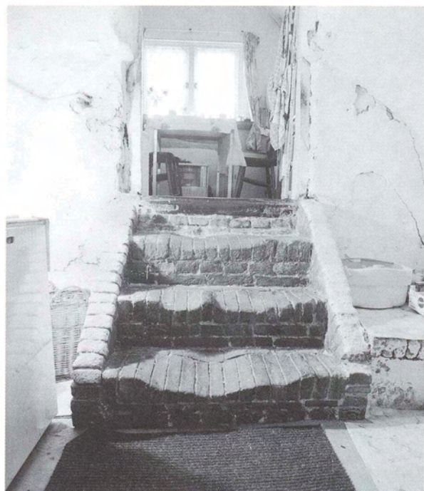
Uitgesleten treden.