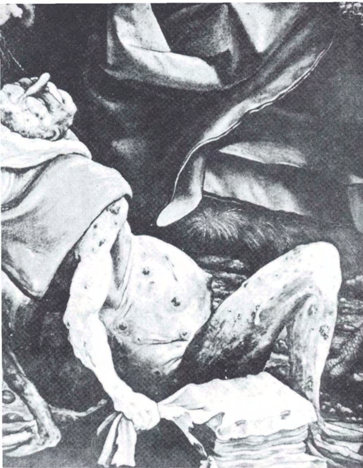
Op een van de vleugels van het magnifieke Isenheimaltaar in Colmar verbeeldde de 16e-eeuwse schilder Mathias Grünewald een lijdend aan syfilis (in een vergevorderd stadium), 1515.