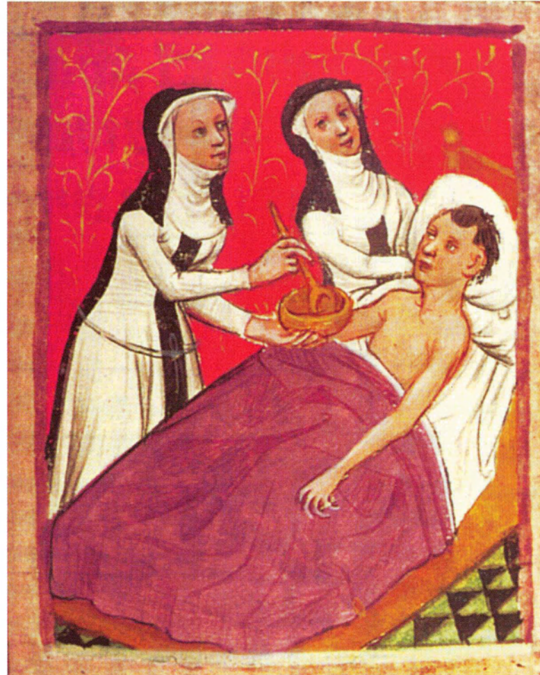
Nonnen verzorgen een zieke in het Onze-Lieve-Vrouwehospitaal te Doornik. Miniatuur uit Doornik, ca. 1400. (Doornik, Kathedraalarchief)

De hierboven geciteerde uitspraak is te lezen in een veel gebruikt overzichtswerk van de geschiedenis van de gezondheidszorg in Nederland. Deze opvatting komt men in de meeste boeken en artikelen over gasthuisgeschiedenis tegen. Enigszins gechargeerd ontstonden de gasthuizen in middeleeuwse steden als uiting van christelijke barmhartigheid. Er werd goed voor de mensen gezorgd. Na 1500 verkeerde dat in zijn tegendeel: rijke mensen en middenklassers lieten zich thuis verplegen en het gasthuis werd een oord waar alleen nog armen, zwerwers en randfiguren terecht kwamen. In sommige boeken, zoals het hierboven aangehaalde, wordt dan ook nog een relatie gelegd met de Reformatie. Wanneer deze haar werk heeft gedaan, breekt een slechte tijd aan, waaraan pas aan het einde van de negentiende eeuw een einde komt. Dan doet de moderne geneeskunde haar intrede in het gasthuis en in relatief korte tijd worden veel nieuwe ziekenhuizen opgericht. Dit verhaal is in al zijn eenvoud duidelijk, maar wanneer viel dan het omslagpunt en wat was de reden van deze omslag? Is het wel juist om te veronderstellen dat wanneer twee gebeurtenissen op elkaar volgen, zij dan ook met elkaar in causaal verband staan? Vast staat dat de meeste stedelijke gasthuizen na 1650 bevolkt werden door paupers en soldaten. Deze mensen ontvingen vaak een slechte verzorging. De medische behandeling droeg een marginaal karakter.