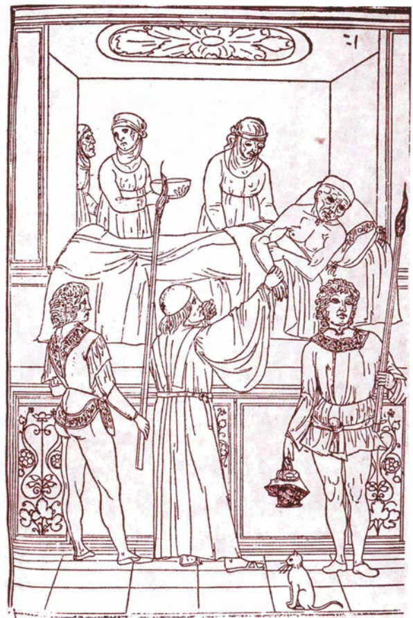
Geneesheer aan het bed van een pestlijder. Houtsnede uit Venetië, 1495.

derd, omdat ze al jaren geen cent soldij hadden gezien, kozen de Staten van Brabant de kant van de opstandelingen. De oorlog was er alleen maar heviger door geworden. In veel steden ontstonden partijen voor en tegen 'de geus', voor de nieuwe gereformeerde religie of voor het behoud van het oude geloof. De grootste groep wilde overigens het liefste alles bij het oude houden. Zij hielden vast aan een traditioneel, door hun ouders overgeleverd complex van denkbeelden, beproefde religieuze gewoonten en praktijken. Behalve de religiekwestie speelde ook de defensie een rol in de discussies. De Brabantse steden hadden vanouds voor hun eigen defensie gezorgd en dat moest zo blijven, dus geen garnizoen van vreemde huursoldaten. Op de vleugels opereerden echter de haviken, de aanhangers van de Reformatie en de Tegen-Reformatie, en deze dwongen steeds meer mensen tot een keuze, voor Genève of voor Rome. In 's-Hertogenbosch kwam het in juli 1579 tot een complete veldslag op de Markt, pal voor het stadhuis. De stad koos tenslotte voor de koning