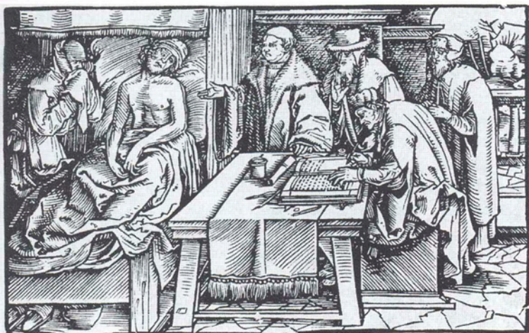
Een notaris, omringd door getuigen, luistert naar de zieke. De notaris schrijft de akte van testament. Een houtsnede uit de Troostspiegel van Petrarca (Augsburg, 1532).