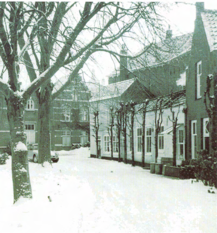
De oude apotheek van het GZG omstreeks 1960. Tot 1980 deed dit laatste restant van het middeleeuwse gasthuis nog dienst.

gasthuis, maar ook pauselijk en door de Souvereine Raad van Brabant toegelaten notaris. Als zielzorger werd hij geroepen, wanneer patiënten het slecht maakten, om hen de laatste sacramenten - biecht, communie en ziekenzalving - toe te dienen. Als notaris was hij ook bevoegd rechtsgeldige testamenten op te tekenen. De combinatie zielzorg met notariaat werkte uitstekend. Het protocol is in zijn soort zeer zeldzaam en daarom door mij destijds door middel van regesten ontsloten, maar er is nog nooit iets mee gedaan. 2 Het bevat in totaal 193 akten, waarvan 186 testamenten en enkele verklaringen van zieken die in het gasthuis lagen.