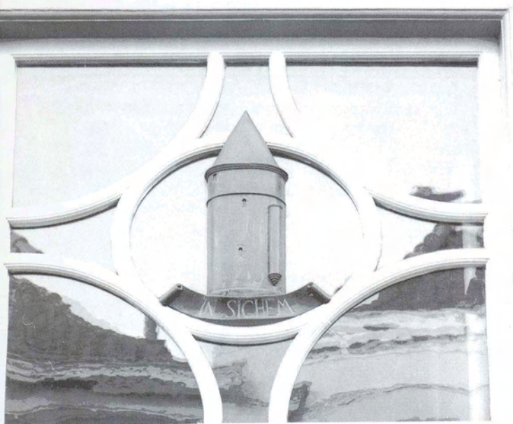
Het bovenlicht in de voordeur: de toren van Zichem in het huidige België. Is er ook een relatie met de zogenoemde 'toren van Sichern' in het oude Israël (o.a. Richteren 9)?

die gelegenheid ook 20 cm. uitgediept om te bewerkstelligen dat men er voortaan rechtop kon staan, hetgeen toch wel noodzakelijk was om deze ruimte tot tv-kamer te kunnen bestemmen, waar bovendien in de achtermuur de resten van wandtegeltjes zijn gemetseld die links en rechts in het huis werden aangetroffen.