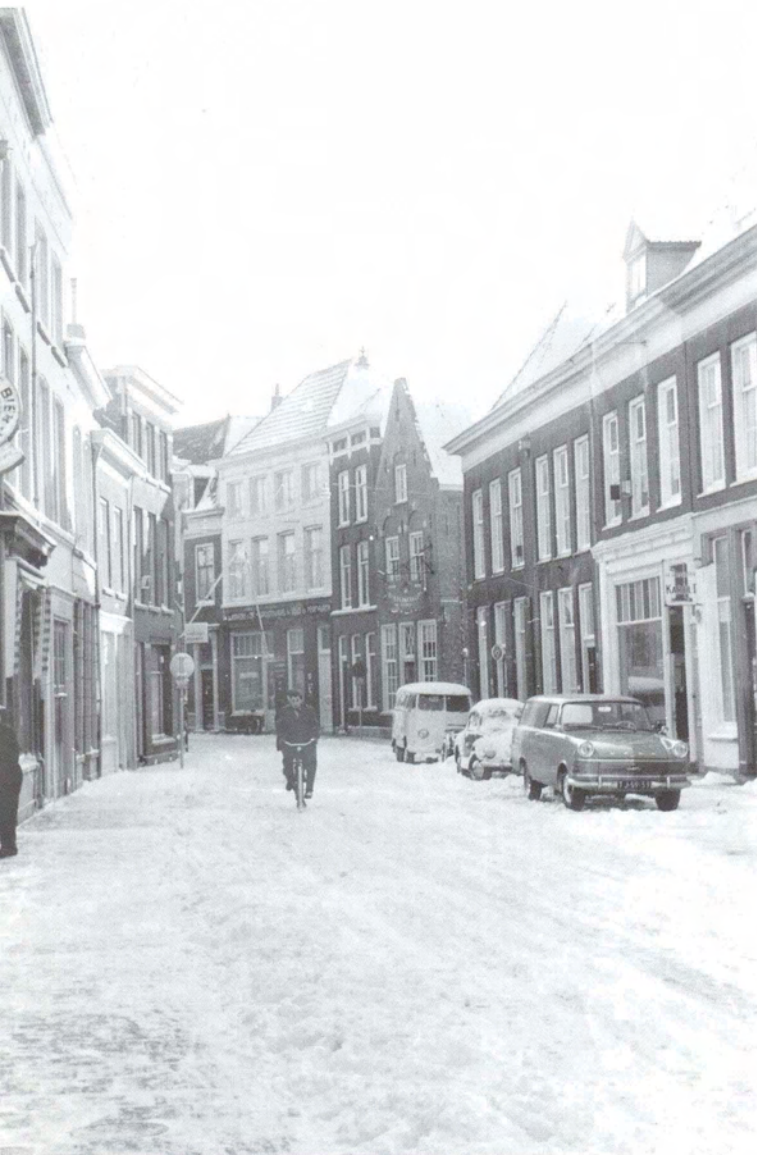
Een fietser ploegt door de Verwersstraat. De besneeuwde Volkswagen staat voor 'In Sichem' geparkeerd. Een foto van ruim veertig jaar geleden.

Jan van der Eerden zijn ingreep zonder meer 'historisch verantwoord' te noemen. Zulks temeer daar de achtergevel die eerder met een zogenaamd wolfseind was afgeknot, met een nieuw topstuk in de oude staat werd teruggebracht. Verder is Van der Eerden niet gegaan, al wijzen ronde bogen boven de bestaande kozijnen er op, dat er vroeger andere ramen in hebben gezeten. Toen Van der Eerden zich in de Verwersstraat vestigde trof hij niet alleen een achtergevel aan die (slecht) bepleisterd was, maar bovendien asymmetrisch bleek. Om dat te