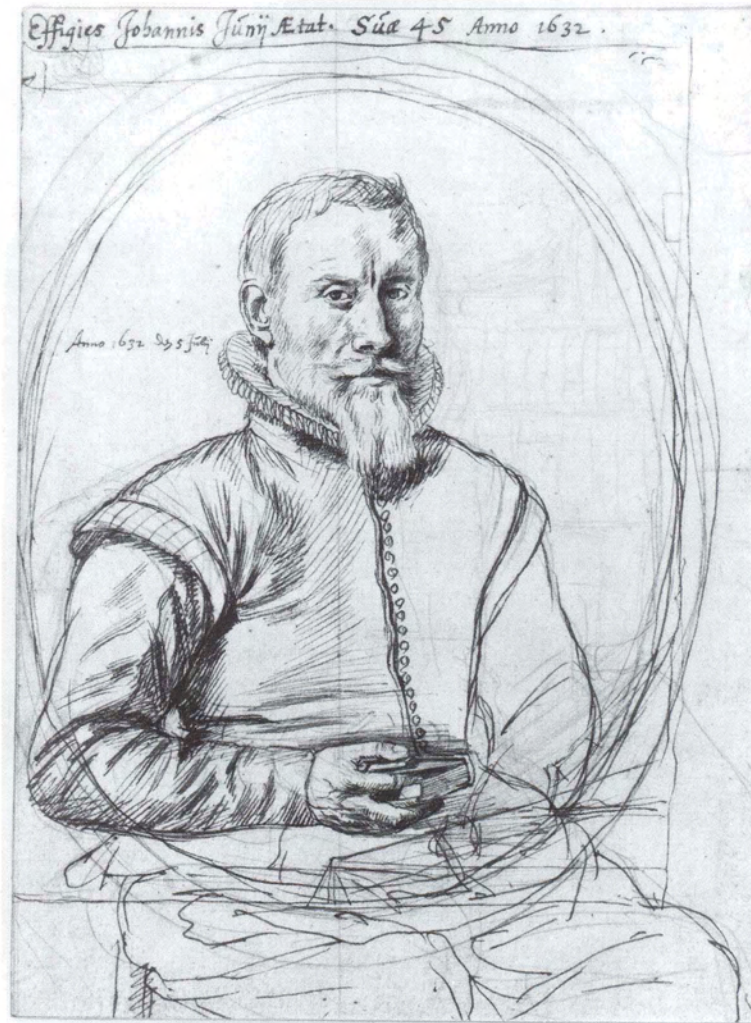
Pieter Saenredam, Portret van Johannes Junius, gedateerd 5 juli 1632, pen en zwart krijt. Dresden, Kupferstich-Kabinett der Staatlichen Kunstsammlungen.

Het portret van Junius heeft de Tweede Wereldoorlog overleefd en bevindt zich nog steeds in het prentenkabinet van Dresden. Het betreft een krijttekening die later is uitgewerkt in pen met bruine inkt. Het blad toont een figuur gezeten achter een tafel met daarop een inktpot met veer. In zijn rechterhand houdt hij een boek. De boekenkast rechts van de man is alleen zichtbaar op de ondertekening en is niet overgenomen in pen. De geportretteerde is rechthoekig uitgekaderd en bevat in een ovale omlijsting. Alles wat buiten het kader valt, in het bijzonder de stoel en de benen, is niet of nauwelijks uitgewerkt en ook de linkerarm is slechts summier aangegeven. Dit doet vermoeden dat het hier om een ontwerp-tekening voor een gravure gaat. Boven aan het blad staat een tekst waarin de geportretteerde wordt geïdentificeerd: 'Effigies Johannis Junij Aetat. Suae 45 Anno 1632' (Portret van Johannes Junius op de leeftijd van 45 jaar, anno 1632). Links van het hoofd wordt die datum nog scherper gesteld: 'Anno 1632 den 5 Julij'.