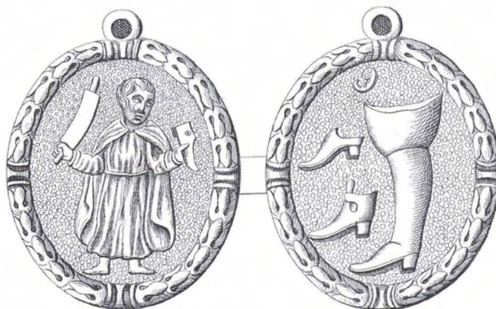
Sint Crispinus, beschermheilige schoenmakers en looiers, op een penning van het Bossche schoenmakersgilde, ca. 1750. Zijn uitgestrekte rechterhand omklemt een looiers schaafmes, in zijn linkerhand een leest. Keerzijde: ruiterslaars met kap en spoor, muil en schoen. (Uit: J. Dirks, De Noord-Nederlandsche gildepenningen , Haarlem, 1878, met Atlas, 1879)

Tot voor kort ging iedereen ervan uit dat er na de definitieve afschaffing van de gilden in 1820 tot aan de oprichting van de eerste moderne werkliedenverenigingen en vakbonden rond 1870 heel weinig zou zijn gebeurd. De sociale bescherming die de gilden hun leden boden ging teloor en de meeste met de gilden verbonden ondersteuningsfondsen zouden zijn geliquideerd. Op de meer open markt die daardoor ontstond waren wel commerciële verzekeraars actief, maar vooral in oudere literatuur