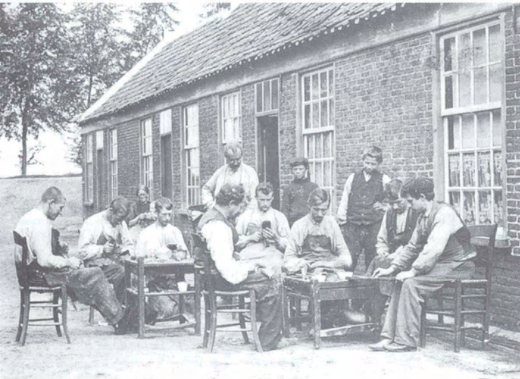
Thuiswerkers buitenshuis: schoenmakers in Waalwijk, ca. 1910 (Collectie Gemeentearchief Waalwijk)

5 cent per week en de uitkering bij overlijden was gelijk aan die van Tot Algemeen Welzijn namelijk f 30 voor een overleden man en f 20 voor een overleden vrouw. 12