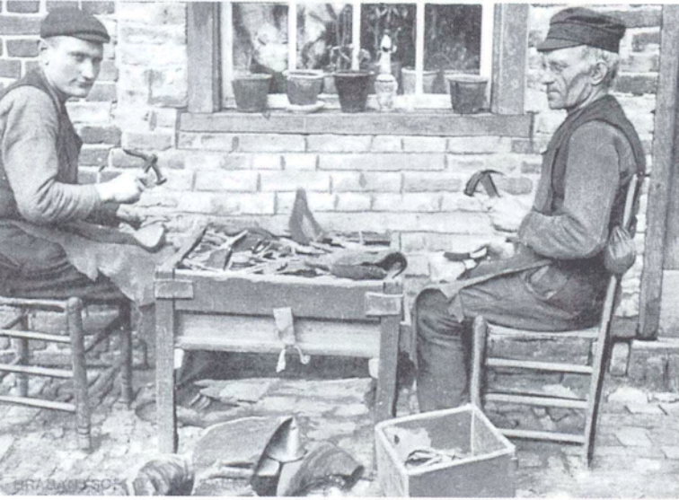
Ergens in Noord-Brabant: nog geen industrie, echt handwerk. Prentbriefkaart, ca. 1904.

ander echt hulp nodig heeft en wat er dan het beste kan gebeuren. De socialisatie kan dus heel wel geleid hebben tot vormen van onderlinge hulp die we in archieven of kranten niet tegenkomen. Kortom, gezelligheid en onderlinge hulp liggen eerder in elkaars verlengde.