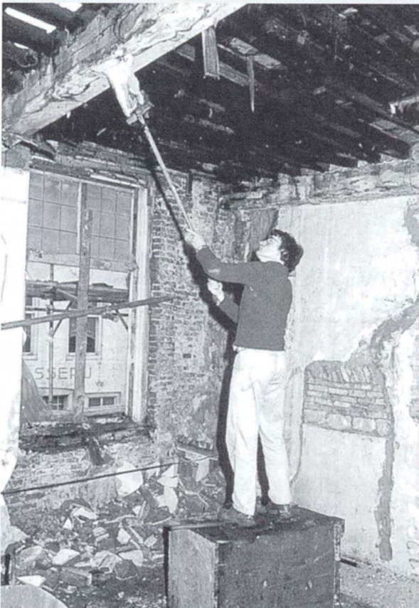
Onderzoeken is ook handwerk

'Het kenmerk van wat hier in Den Bosch op bouwhistorisch gebied is ontstaan, is samenwerking. Het historisch stadskernonderzoek van Den Bosch is niet iets van één discipline. Het zijn verschillende disciplines, zoals daar zijn de geschreven bronnen en de archeologie. Tussen die twee heeft de bouwhistorie haar plaats gekregen als schakel tussen de ondergrondse bronnen van de archeologie en de geschreven bronnen.'