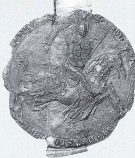
Hertog Jan II te paard. Het zegel hangt aan de oorkonde uit 1300 waarbij de hertog gemeenschappelijke gronden aan de inwoners van 's-Hertogenbosch, Berlicum, Middeldode, Rosmalen en Hintham verkooft.

Bij ieder aspect van de laatmiddeleeuwse of vroegmoderne geschiedenis van de Meierij zal men steeds stuiten op de enorme aantrekkingskracht en dominantie van Den Bosch. De stad oefende een grote zuigkracht uit op mensen en middelen uit de Meierij en zelfs van daarbuiten. Zoals iedere middeleeuwse stad was ook Den Bosch voor de aanvulling van zijn inwonertal afhankelijk van voortdurende immigratie uit het platteland, ter compensatie van het sterfteoverschot in de stad, als gevolg van de slechtere hygiënische omstandigheden, de hogere besmettingsgraad bij epidemieën en het lagere kindertal in de steden. 6 Juridisch, economisch en fiscaal overheerste de stad haar achterland, het platteland van de Meierij. De hoogschout van Den Bosch was de hoogste juridische