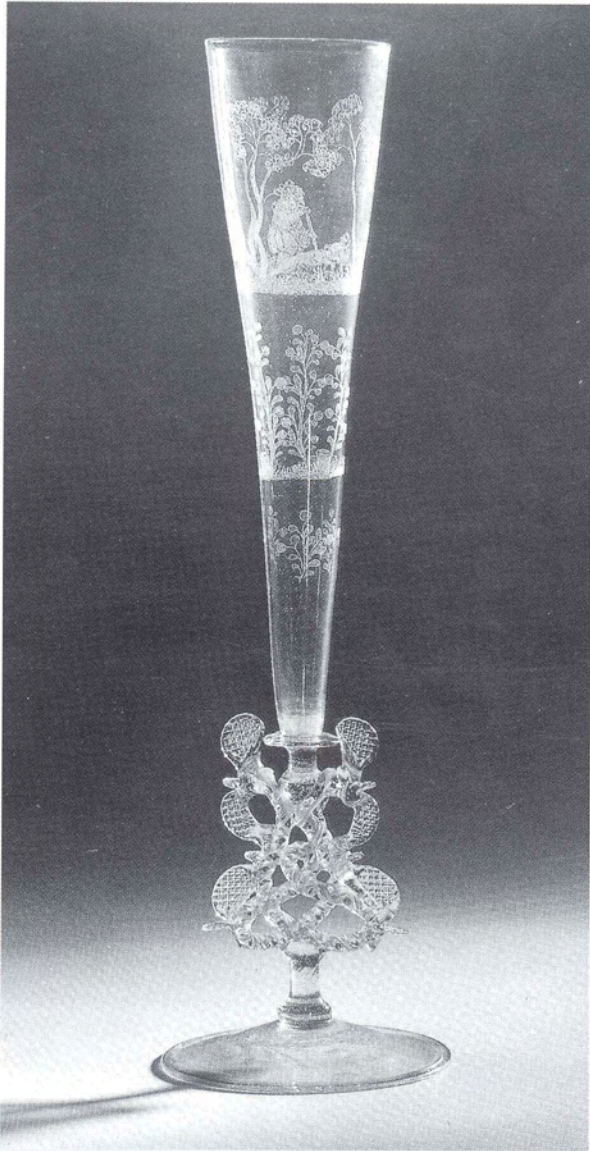
Een zeventiende-eeuws 'serpentglas' dat in Nederland is vervaardigd (geveild in 1989 bij Christie's).