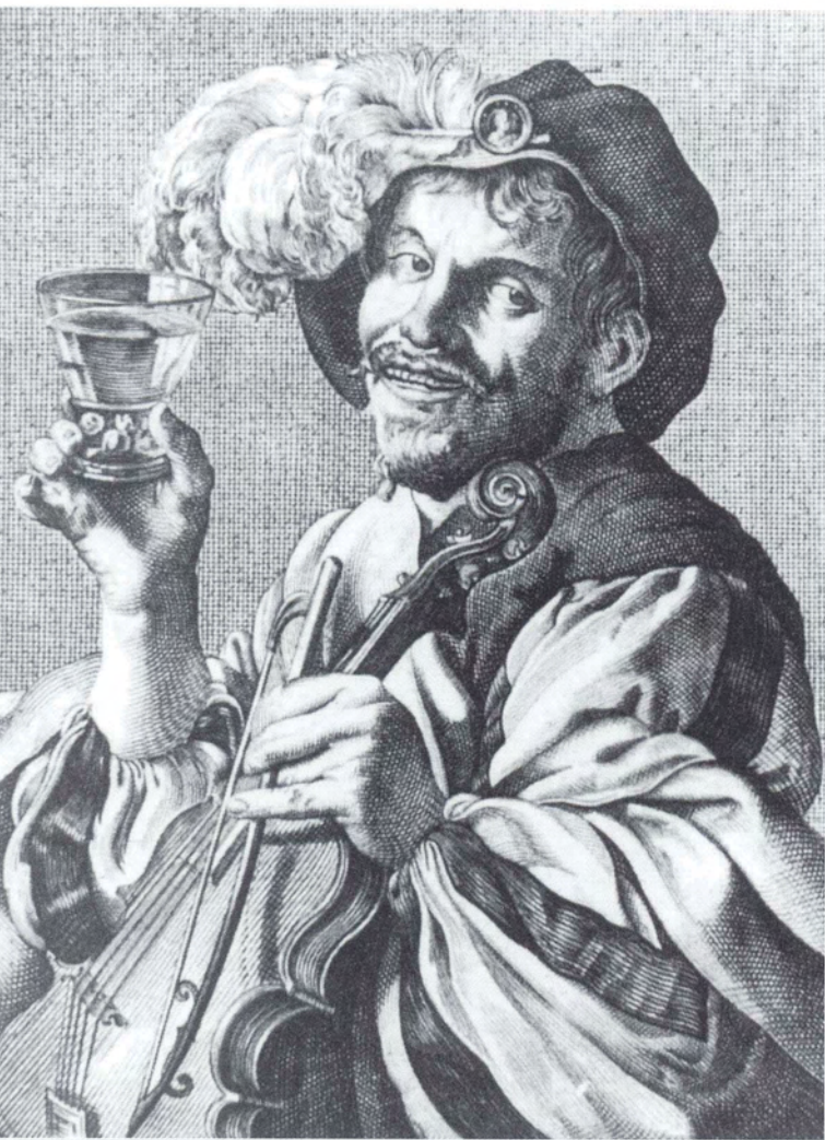
Een vrolijke violist met een waarschijnlijk groen-getinte roemer wijn. Gravure naar Hendrik Terbrugghen (begin 17e eeuw).

Venetiaanse blazers beproefden rond 1500 een combinatie van grondstoffen waarmee zij kleurloos glas vervaardigden, een belangrijk verschil met het gangbare groen getinte 'waldglas'. In plaats van pot- of houtas - waarvoor hele bossen werden geveld 16 - werd nu soda (gewonnen uit zeewier) gebruikt. Dit Venetiaans glas dat zeer fijn en fragiel is, heette 'cristallo'.