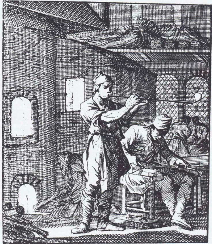
De glasblazerij, een gravure uit 'Het Menselyk Bedryf' van de gebroeders Luiken (1694).

De koningin kreeg bij haar afscheid van de vorst ook cadeautjes. 'Salomo gaf aan de koningin van Scheba al wat zij begeerde en vroeg, behalve wat hij haar schonk, zoals men dat van koning Salomo verwachten mocht.'