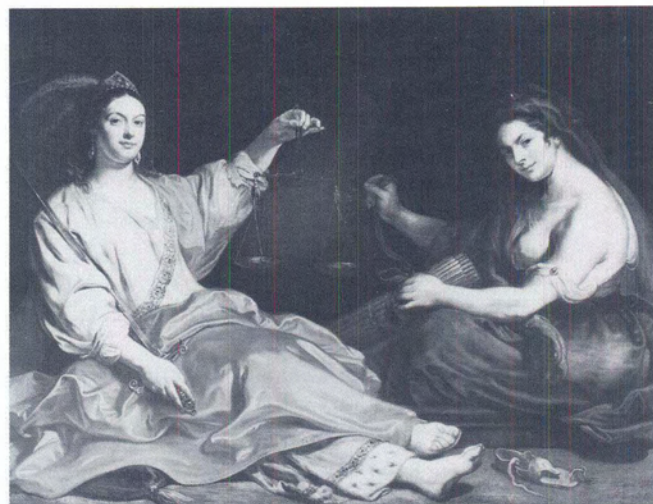
Van Thuldens schilderij 'Eenheid en Gerechtigheid' is te bewonderen in het Stadhuis.