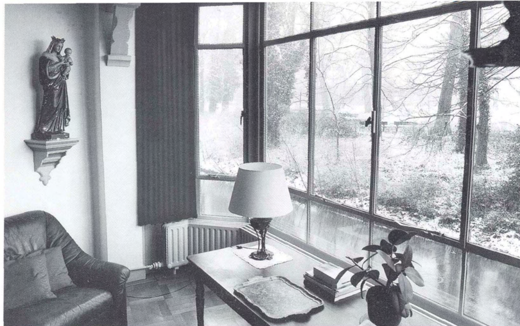
Zicht op de Casinotuin

een bosje patiënten zich voor de voordeur ophoopte, wachtend tot het spreekuur begon.