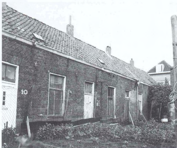
Dezelfde huisjes zoals ze er nog in 1981 stonden. (Foto: Stadsarchief, HTA, stamboeknr. 6611).

Bij de behandeling van de begroting voor het jaar 1901 kwam het onderwerp 'krotten' weer aan de orde. Enkele raadsleden pleitten voor een meer actieve opstelling van de gemeente. Zo was het mogelijk om arbeiderswoningen te bouwen langs de rijkswegen 's-Hertogenbosch-Orthen en 's-Hertogenbosch-Hintham. In verband met de frequente overstromingen was het niet mogelijk om buiten de wallen te bouwen, tenzij men, zoals in de nieuwe wijk 't Zand gebeurde, het bouwterrein eerst ophoogde. De stichtingskosten van nieuwe huizen werden daardoor te duur voor arbeiderswoningen. De rijkswegen lagen echter op een dijklichaam zodat daar wel gebouwd kon worden. Het raadslid de heer L.J.C. Bogaerts (raadslid van 1891 tot aan zijn dood in 1913) diende een motie