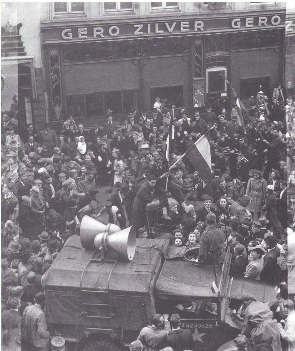
Na de bevrijding van 's-Hertogenbosch in oktober 1944 was er door de blijvende oorlogsdreiging weinig reden tot uitbundigheid. Pas op 20 maart 1945, bij het bezoek van koningin Wilhelmina, gingen de Bosschenaren massaal de straat op (Stadsarchief 's-Hertogenbosch, Hist.-Top. Atlas, stamboeknr. 48.619).