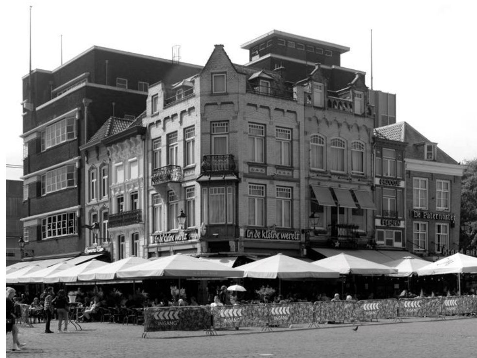
Aanzicht van het blok op de Markt en de voormalige locatie van het verblijf van hertog Hendrik I op de Markt.