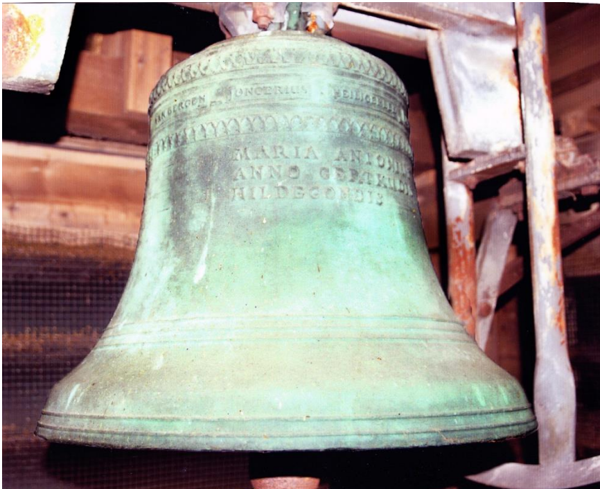
De luidklok zoals die sinds 1949 in de klokkentoren hangt

Uit de geschiedenis van de kerken in Engelen blijkt nergens dat deze namen een belangrijke rol zouden hebben gespeeld. De vraag rijst derhalve waarom deze juist deze namen op de klok staan vermeld.