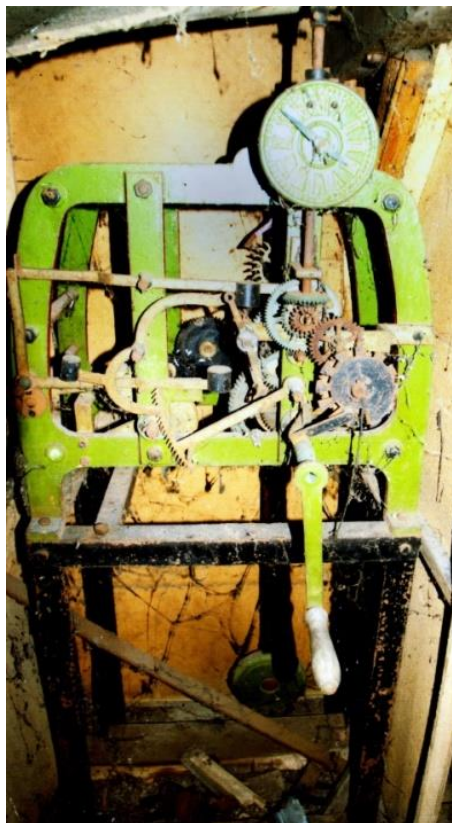
Het uurwerk

Bij de inspectie van het torentje in de kerk door de leverancier bleek alras dat het uurwerk op een zodanige plaats zou moeten worden gemonteerd, dat het dagelijks handmatig opwinden ervan een ondoenlijke zaak zou gaan worden. Dat kon slechts via een ladder die aan de buitenzijde over het dak moest worden gelegd. Het uurwerk moest derhalve elektrisch worden uitgevoerd, hetgeen een meerprijs van maar liefst 800 Gulden betekende. Bovendien was inmiddels besloten dat, teneinde het uurwerk vanuit alle plaatsen goed te kunnen zien, het toch wel gewenst was een derde wijzerplaat te monteren. Ook dit verhoogde de prijs met 150 Gulden. Tenslotte had men verzuimd in te calculeren dat er nog werk van timmerman Leijte in het torentje nodig was om een en ander voor te bereiden op het ophangen van het nieuwe uurwerk en dat zou ook nog eens zo'n 250 Gulden gaan kosten. Al met al zou het nieuwe uurwerk hierdoor niet ruim 1200, maar zo'n 2500 Gulden gaan kosten, ver boven het budget van de ingezamelde gelden!