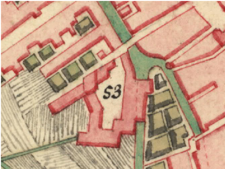
Van de Mijll 1773