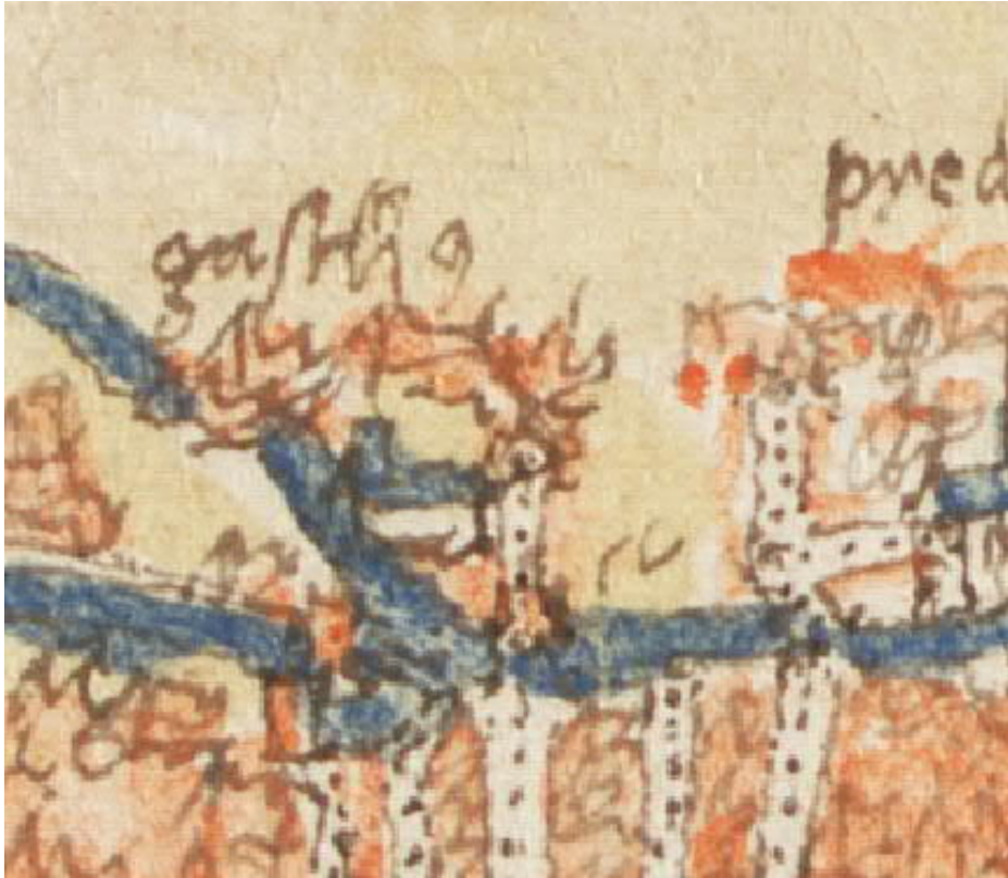
Jacob van Deventer 1545