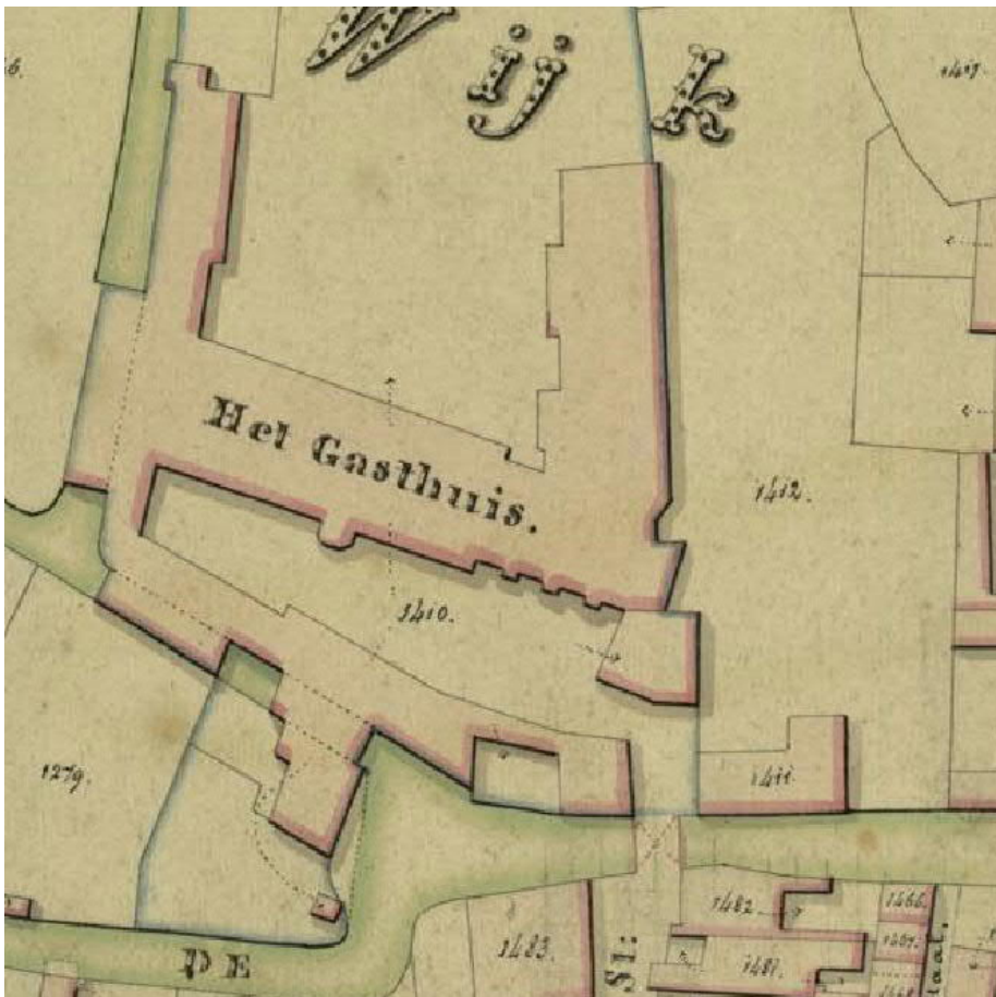
Kadastrale minuut 1823: