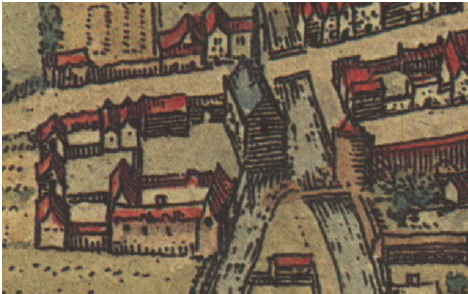
Braun en Hogenberg 1588