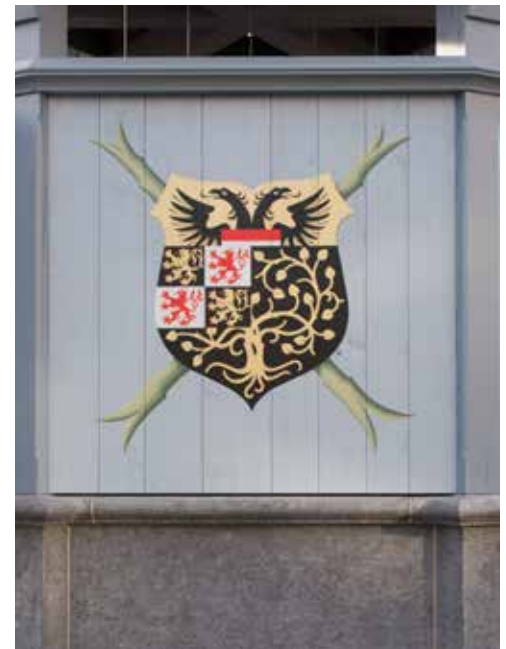
DETAIL VAN DE STADSPUIT MET HET STADSWAPEN. OP ANDERE PANELLEN STAAN DE WAPENS VAN HET HERTOGDOM EN VAN KEIZER KAREL V.

van hout, het dak gedekt met leien. Op het puthuis kwam een bekroning met adelaars en een kopie van de vergulde keizerskroon van Karel V.