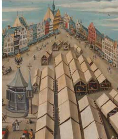
UITSNEDEN UIT HET SCHILDERIJ DE LAKENMARKT TE 'S-HERTOGENBOSCH, 1530 (COLLECTIE NOORDBRABANTS MUSEUM, 'S-HERTOGENBOSCH).

De nieuwe, oude stadspuit en dito OLV-huisje zien er ongeveer zo uit als hun voorgangers in 1522. Al in de middeleeuwen stond midden op de Markt in 's-Hertogenbosch een stadspuit met in de nabijheid een schandpaal, bekroond met een kapelletje. Dat gold als symbool van stedelijke rechtsmacht. In de tijd dat er nog geen waterleiding was, zorgden welputten voor het drinkwater. Daartoe diende ook de put op de Markt, die bovendien gebruikt werd voor het putten van bluswater bij brand. Het bouwwerk had verder als ontmoetingsplaats voor de burgerij een belangrijke sociale functie. Het 'Lievrouwehuisken' op de schandpaal naast de stadspuit bleek in 1498 aan vernieuwing toe. Vermeld wordt dat een flink bedrag voor de aankoop van natuursteen wordt uitgegeven. Uit stadrekeningen blijkt, dat in 1522 op een bestaande welput een nieuw puthuis gebouwd werd. De basis was van natuursteen, de opbouw