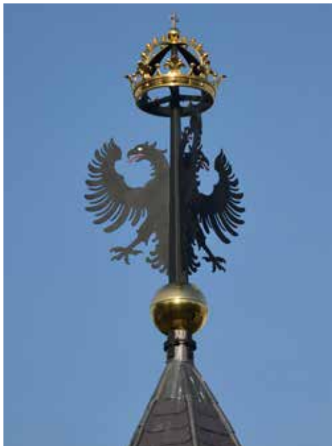
DE BEKRONING VAN DE STADSPUIT MET DE ADELAARS EN KEIZERSKROON.

Najaar 2013 maakte Weyts Architecten een ontwerp dat geënt was op het schilderij 'de Lakenmarkt', dat echter wel in het juiste perspectief