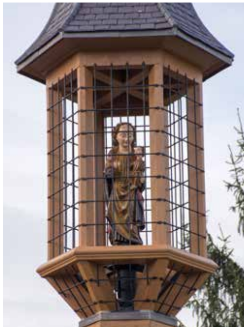
DETAIL VAN HET ONZELIEVROUWEHUISJE. HET BEELD IS EEN KOPIE VAN EEN BOSCH' BEELD UIT HET BEGIN VAN DE 16E EEUW.