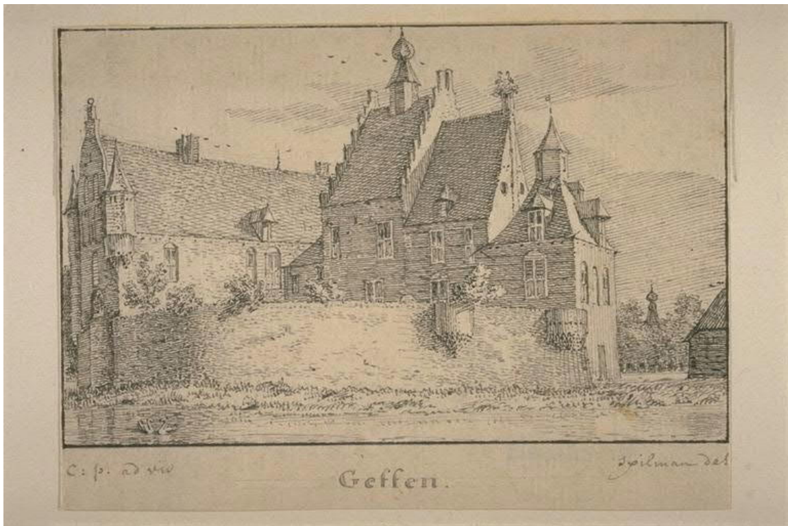
(naar) Cornelis Pronk (ca 1732)