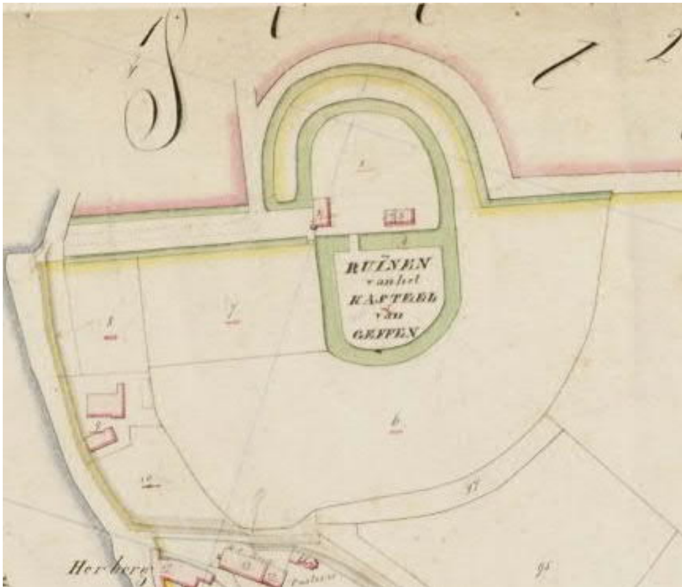
Detail kadastrale minuut 1832