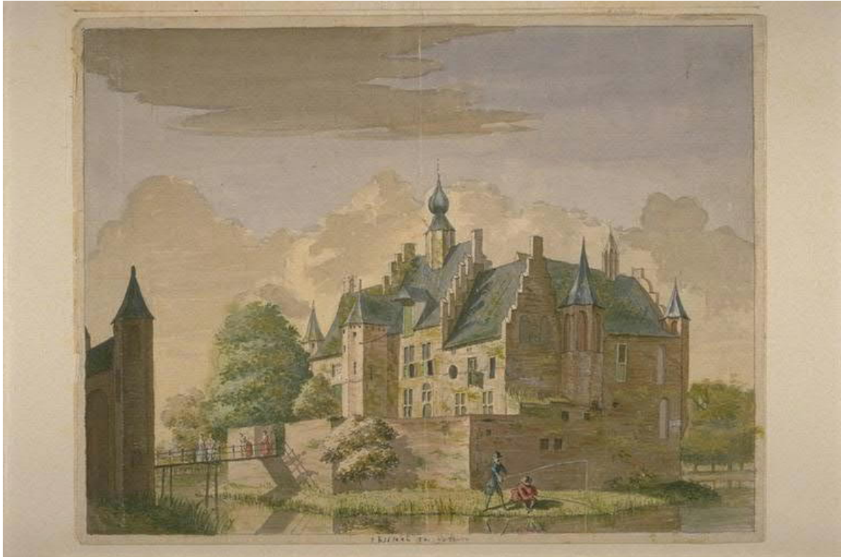
Brabant collectie 0825-041