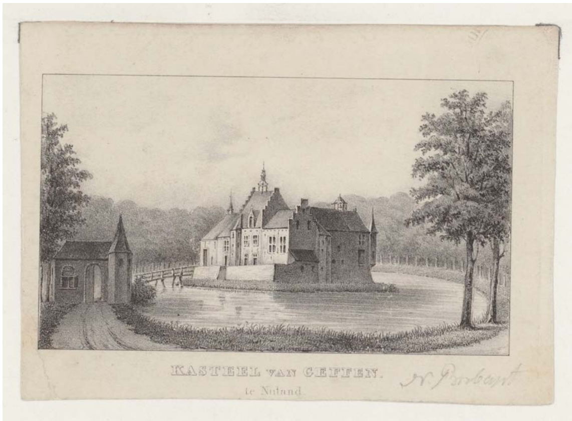
Lithografie, circa 1790