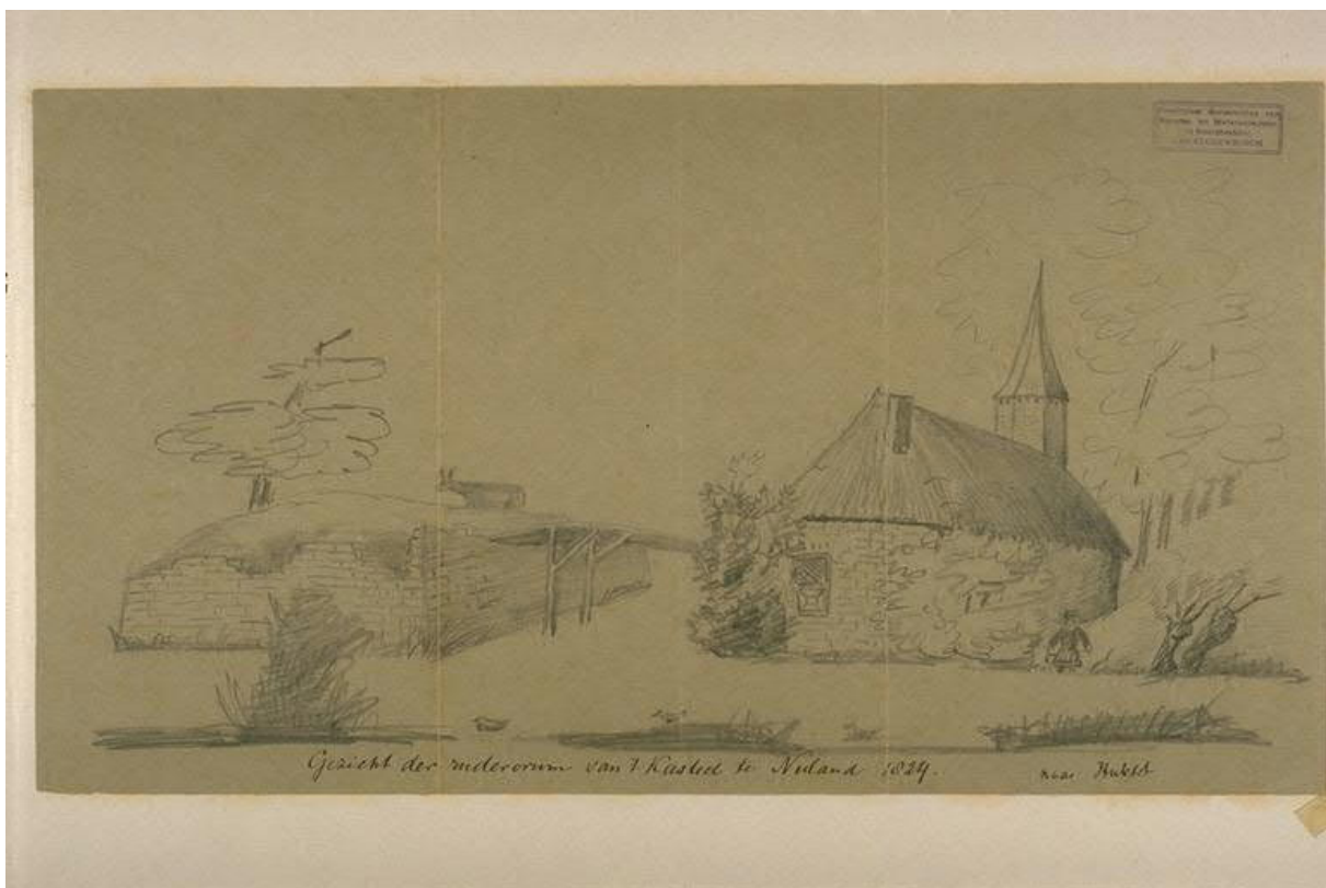
Brabant collectie 0825-043