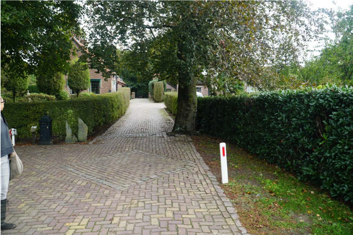
Situatie tijdens veldbezoek.