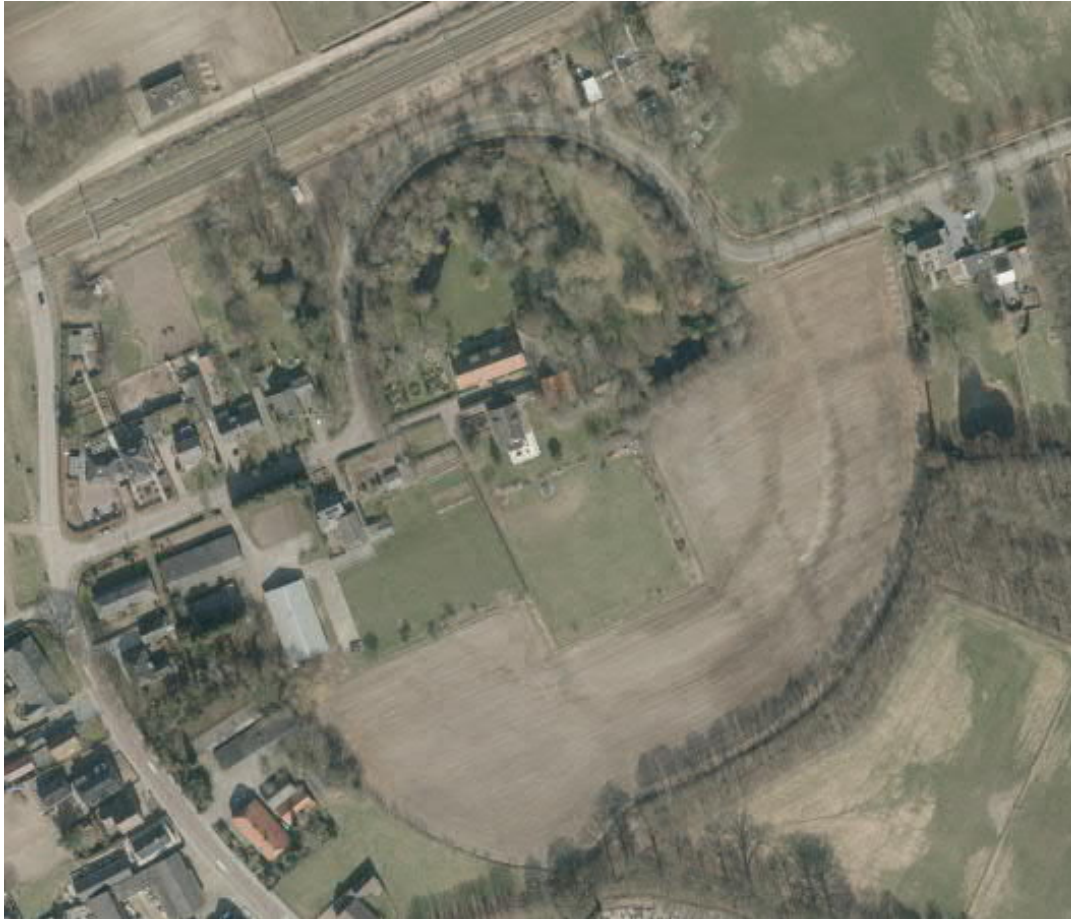
Luchtfoto van de omgeving van het kasteel uit 2013. De grachten tekenen zich hierop als donkere banen af.