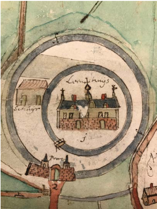
Uitsnede uit kaart van Nuland 1665