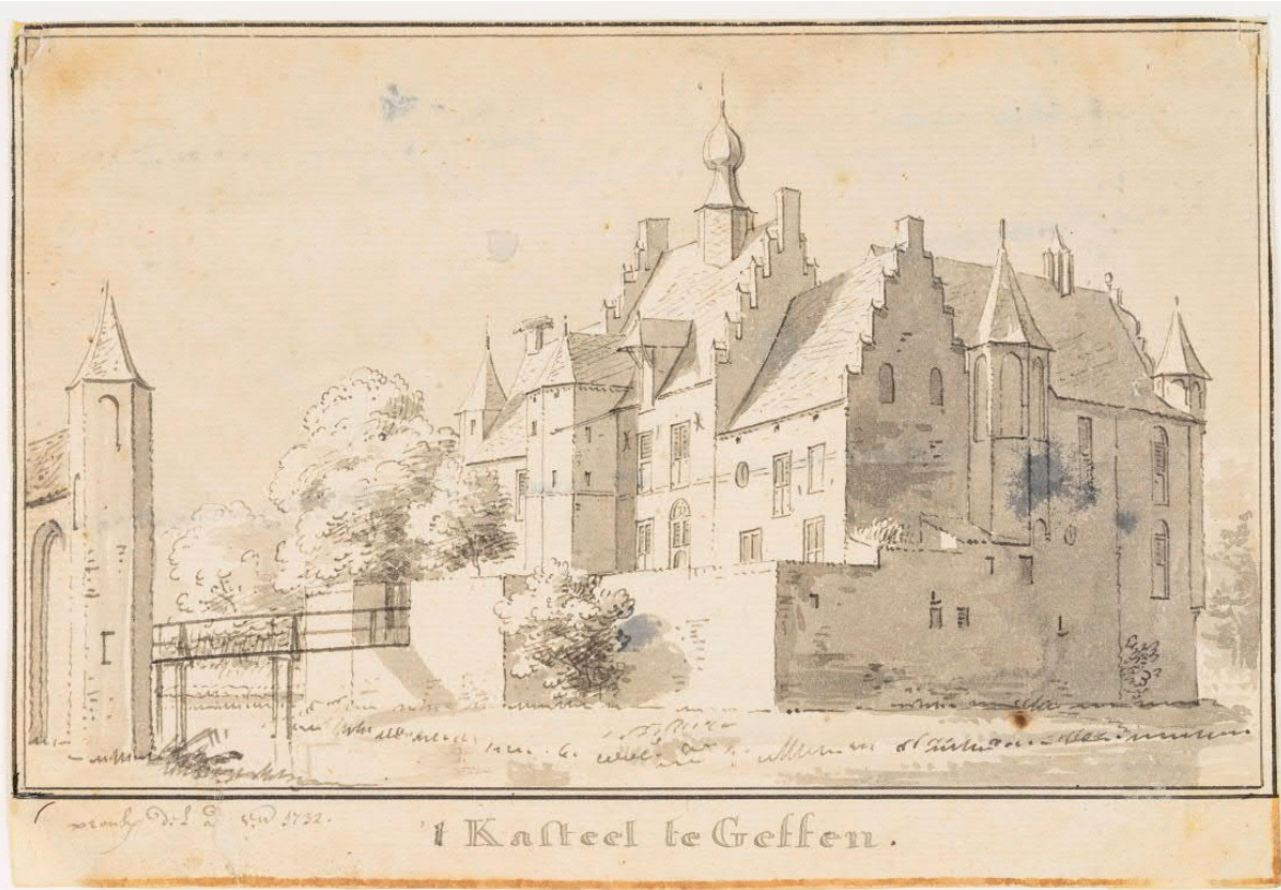
(naar) Cornelis Pronk (ca 1732)