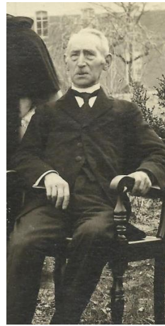
2 e zoon Antonius M.